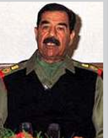
အီရတ်သမတ ဆက်ဒမ်ဟူစီန်

ဘုရားအနေဖြင့် လိုအပ်ပါက အင်အားသုံးပြီး အီရတ်အား လက်နက်ဖြတ်ရန် ဆန္ဒရှိသူများ ညွှန်ပေါင်းအဖွဲ့အား ဦးဆောင်ရန် သိန္နီဌာနချုပ်ပြီး ဖြစ်သည်။