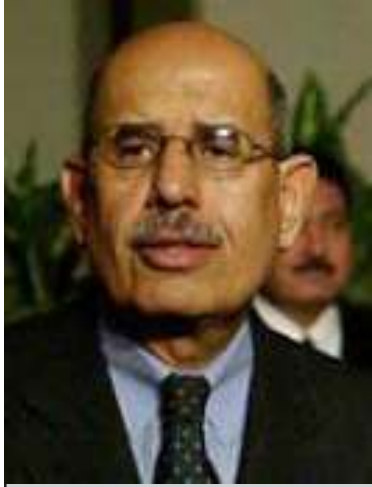
အနုမြူစွမ်းအင် အေဂျင်စီအကြီးအကဲ မိုဟာမက် အယ်လ်ဘာရာဒေး

(အပြည်ပြည်ဆိုင်ရာ အနုမြူစွမ်းအင် အေဂျင်စီ-IAEA)