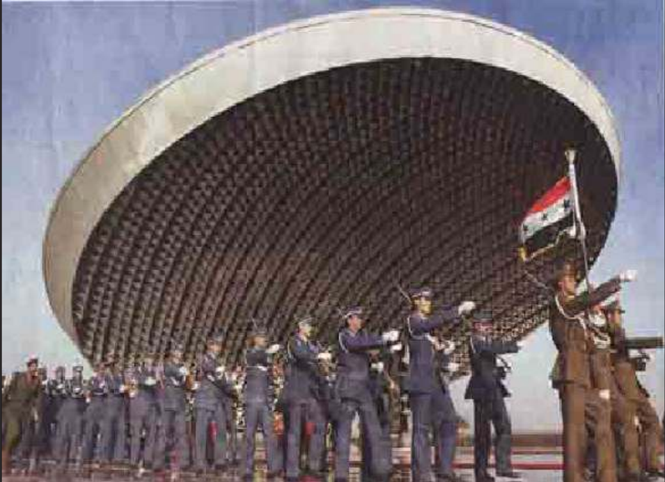
တပ်မတော်နေ့ စစ်ရေးပြအခမ်းအနား၌ ဘဂ္ဂဒက်ရှိ အညတရစစ်သည်များ ဂူမိဗွာန်ရှေ့တွင် အီရတ်စစ်သားများ ချီတက်နေကြစဉ်

အမေရိကန်စစ်သား ပထမအုပ်စုသည် အီရတ်ပြည်ပြေး(၃၀၀၀)အထိ စစ်ရေးလေ့ကျင့်နိုင်သော လေ့ကျင့်ရေးစခန်း ပြင်ဆင်ရန် တပ်စာလေတပ်အခြေစိုက်စခန်းသို့ ရောက်နေပြီဟု ဟန်ဂေရီ ကာကွယ်ရေးဝန်ကြီးက ပြောကြားခဲ့သည်။ စစ်ပွဲကာလအတွင်း ၎င်းတို့သည် စကားပြန်များနှင့် လမ်းပြများအဖြစ် ဆောင်ရွက်ပြီး ဆက်ဒမ်အား ဖယ်ရှားပြီး ပါက အုပ်ချုပ်ရေးလုပ်ငန်းများတွင် အမှုထမ်းကြမည်ဖြစ်သည်။ ❖