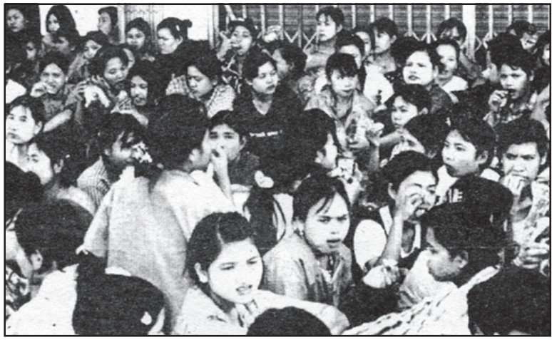
ဝမ်းရေးအတွက် ဖမ်းဆီးခံခဲ့ရသည့် မြန်မာအလုပ်သမားလေးများ ရင်အေးနိုင်ပြီလား ....

ထိုင်းအစိုးရက ယခုကဲ့သို့ တနှစ် သက်တမ်းရှိ အလုပ်သမားလက်မှတ်များ အား (၂၀၀၁)ခုနှစ်မှစ၍ ထုတ်ပေးလာခဲ့ရာ ထိုနှစ်တွင် မြန်မာလူမျိုးအလုပ်သမား ငါး သိန်းခြောက်သောင်းကျော်ရှိခဲ့ပြီး ၂၀၀၂ ခုနှစ်တွင် သုံးသိန်းငါးသောင်းကျော် ပြုလုပ်ခဲ့ ကြသည်ဟု ဆိုသည်။ ယခုနှစ်တွင် တာ၀်ခရိုင်တခုတည်း အတွက် သတ်မှတ်အလုပ်သမားဦးရေ(၂၀၀၀၀) ကျော်ရှိရာ ယမန်နှစ်ကထက် အလုပ်သမား ဦးရေ ပိုမိုများပြားလာဖွယ်ရှိသည်ဟု မဲဆောက်မြို့ခံများအဆိုအရ သိရသည်။ ယခုကဲ့သို့ ထိုင်းအစိုးရက တရားမဝင် ဝင်ရောက်လာသူ နိုင်ငံခြားသားအလုပ်သမား များအား ထိန်းချုပ်ရန် ဆောင်ရွက်လျက်ရှိ သော်လည်း အိမ်နီးချင်းနိုင်ငံများဖြစ်သည့် မြန်မာ၊ ကမ္ဘောဒီးယားနှင့် လာအိုနိုင်ငံတို့မှ တရားမဝင် လာရောက်အလုပ်လုပ်ကိုင်နေ သောဦးရေကို တားဆီးနိုင်ခြင်း မရှိသေး ကြောင်း သိရသည်။ ❖