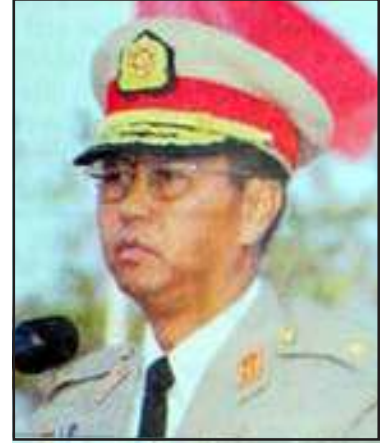
ရန်ကုန်တိုင်း စစ်ဌာနချုပ် တိုင်းမှူး ဗိုလ်ချုပ်မြင့်ဆွေ

ဇန်နဝါရီ (၄)ရက် (ရန်ကုန်) နအဖ စစ်အုပ်စုက ကြီးမှူးကျင်းပသည့် (၅၅)နှစ်မြောက် လွတ်လပ်ရေးနေ့ အခမ်းအနားကို ရန်ကုန်မြို့ ပြည်သူ့ရင်ပြင်၌ ကျင်းပပြုလုပ်ခဲ့ရာ အဆိုပါအခမ်းအနားသို့ နအဖ ဥက္ကဋ္ဌ ဗိုလ်ချုပ်မှူးကြီးသန်းရွှေက သဝဏ်လွှာတစောင်ပေးပို့ခဲ့သည်။ အဆိုပါသဝဏ်လွှာကို ရန်ကုန်တိုင်း စစ်ဌာနချုပ်တိုင်းမှူး ဗိုလ်ချုပ်မြင့်ဆွေက ဖတ်ကြားသွားခဲ့ရာတွင် နိုင်ငံတော်၏ လွတ်လပ်ရေးနှင့် အချုပ်အခြာအာဏာ တည်တံ့ခိုင်မြဲရေးအတွက် နိုင်ငံသားအားလုံး စုစည်းထိန်းသိမ်းစောင့်ရှောက်ရန်နှင့် မျိုးချစ်စိတ်ဓာတ်ကို မျိုးဆက်သစ်များက ဆက်လက်ထိန်းသိမ်းစောင့်ရှောက်ကြရန်လိုကြောင်း ထည့်သွင်းဖော်ပြထားပြီး မြန်မာနိုင်ငံ၏စီးပွားရေးကဏ္ဍတွင် နအဖက ပထမကာလတို လေးနှစ်စီမံကိန်းနှင့် ဒုတိယကာလတို ငါးနှစ်စီမံကိန်းများ အကောင်အထည်ဖော် ဆောင်ရွက်ခဲ့ရာ လျာထားချက်များ ကျော်လွန်သည်အထိ အားထုတ်နိုင်ခဲ့ကြောင်း၊ ယခု တတိယကာလတို ငါးနှစ်စီမံကိန်း ချမှတ်ဆောင်ရွက်