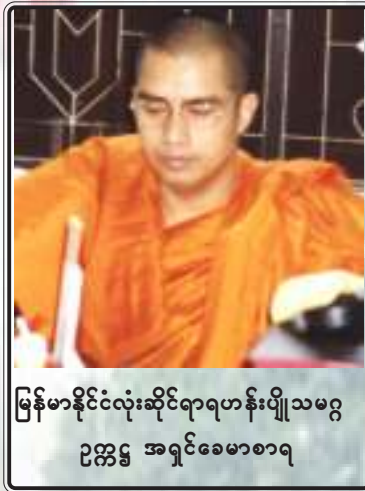
မြန်မာနိုင်ငံလုံးဆိုင်ရာရဟန်းဂျီသမဂ္ဂ ဥက္ကဋ္ဌ အရှင်ခေမာစာရ

“ရွေးကောက်ပွဲနိုင်ပါတီကို အာဏာလွှဲပေးမှာ ဖြစ်တယ်။ နိုင်တဲ့ပါတီကပဲ ဒီမိုကရေစီဖော်ဆောင်ကြပါ။ စစ်တပ်ကတော့ စစ်တန်းလျားကိုပြန်မယ်”