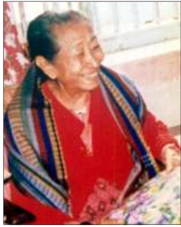
လူထုဒေါ်အမာ

နှစ်အတွက် စာပေလွတ်လပ်ခွင့်ဆုပေးရန် ပြင်သစ်အခြေစိုက် နယ်ခြားမဲ့သတင်း ထောက်များအဖွဲ့က အဆိုပြုထားကြောင်း သိရသည်။