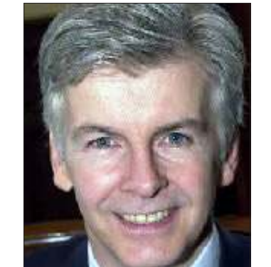
မိုက်အိုဘာဂိုင်းယန်