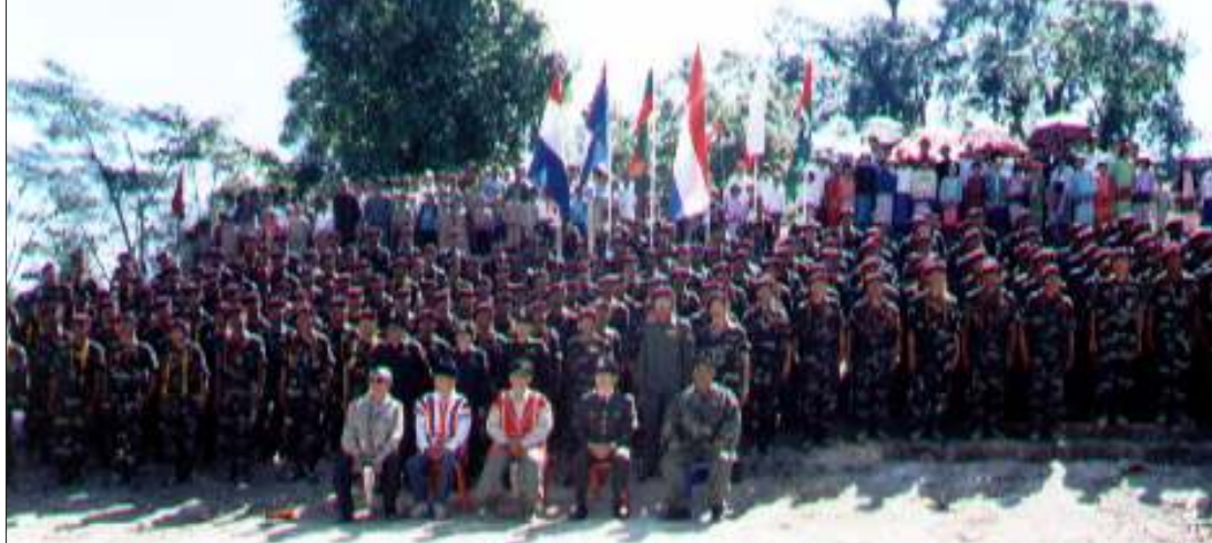
စစ်ရေးမဟာမိတ်(၅)ဖွဲ့မှ ခေါင်းဆောင်များနှင့် သင်တန်းဆင်းရဲဘော်များ

အား လာရောက်တက်ရောက်ခြင်းသည် ထူးခြားမှုဖြစ်သည်ဟု ယနေ့ကာလ မြန်မာ့နိုင်ငံရေးအက်ခတ်တဦးက မိုးကြိုးသို့ပြောဆိုသည်။ ကရင်အမျိုးသားလွတ်မြောက်ရေး တပ်မတော်ကမူ ခရီးသွားလာရေး အခက်အခဲကြောင့် ယင်းသင်တန်းသို့ တက်ရောက်နိုင်ခြင်းမရှိဟု သိရှိရသည်။ ❖