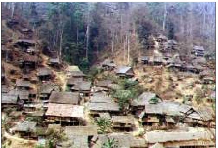
နယ်စပ်ဒုက္ခသည်စခန်းလေးတခု၏ အဝေးမြင်ကွင်း

မျက်နှာပန်းလှ၍ နိုင်ငံရေးတည်ငြိမ်မှုကို လည်း ပိုပြီးပြု၍ရနိုင်သည်ဟူသော ရည်ရွယ် ချက်များ ရှိနေသောကြောင့်ဟု ဆိုလိုက် သည်။ စစ်အုပ်စုသည် ဒုက္ခသည်စခန်းများ အား ရည်ရွယ်ချက်ရှိရှိ ဖျက်ဆီးနေပြီး မမျက်သိမ်းနိုင်သည့်တိုင် ပြဿနာအမျိုးမျိုး ဖြစ်စေရန် ပြုလုပ်နေသည်ဟု ပိုက်ဘလူး၏ အဆိုအရ သိရသည်။ ❖