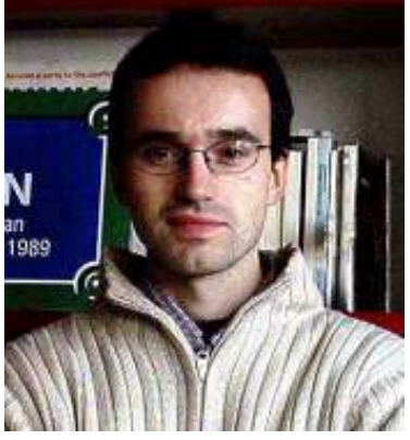
မင်းဆင့်ဗိုဇော်