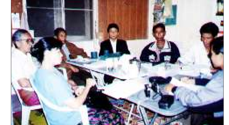
ရခိုင်ပြည်လွတ်မြောက်ရေးပါတီ၏ ဗဟိုကော်မတီအစည်းအဝေးကျင်းပနေစဉ်

ထို့ပြင် လူ့အခွင့်အရေး၊ ဒီမိုကရေစီရရှိရေးနှင့် အမျိုးသားအခွင့်အရေးများအတွက် အမျိုးသားဒီမိုကရေစီ တပ်ပေါင်းစုနှင့်လည်းကောင်း၊ စစ်ရေးမဟာမိတ်အဖွဲ့များနှင့်လည်းကောင်း၊ အမျိုးသားကောင်စီနှင့်လည်းကောင်း ပိုမိုခိုင်မာသော ဆွေးနွေးညီညွတ်ရေးကို တည်ဆောက်၍ ဆက်လက်တိုက်ပွဲဝင်သွားမည်ဟု သန္နိဋ္ဌာန် ချမှတ်ခဲ့ကြပြီး နိုင်ငံအတွင်း အပစ်အခတ်ရပ်စဲရေးနှင့် နိုင်ငံရေးအကျဉ်းသားအားလုံး ခြွင်းချက်မရှိ ပြန်လွတ်ပေးရေး၊ နိုင်ငံရေးပါတီများအားလုံး လွတ်လပ်စွာ လှုပ်ရှားခွင့်ပြုရေးနှင့် သုံးပွင့်ဆိုင်ဆွေးနွေးပွဲဖြင့် နိုင်ငံရေးဖြေရှင်းပေးရေးတို့ကို တောင်းဆိုထားသည်။