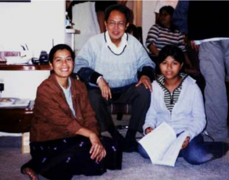
အမျိုးသားညွှန်ပေါင်းအစိုးရဝန်ကြီးချုပ် ဒေါက်တာစိန်ဝင်းနှင့်မိသားစု

အယ်ဒီတာလုပ်ဖို့ ကမ်းလှမ်းတာကို လက်မခံခဲ့ဘဲ ပါရဂူဘွဲ့ရအပြီးမှာ မြန်မာနိုင်ငံကို ပြန်လာခဲ့ပါတယ်။ တတ်တဲ့ပညာနဲ့ ပြည်သူလူထုကို အလုပ်အကျွေးပြုမယ်ဆိုတဲ့ စိတ်ဓာတ်နဲ့ ရန်ကုန်တက္ကသိုလ် သင်္ချာဌာနမှာ အချိန်ပိုင်းပါမောက္ခ ဝင်လုပ်ခဲ့ပါတယ်။ အဲ့ဒီမှာပဲ အသက် ၂၀ ကွာတဲ့ M.Sc ကျောင်းသူလေးစိစိနဲ့ တွေ့ပြီး ဖူးစာဆုံခဲ့ကြတာဖြစ်ပါတယ်။ “ဆရာနဲ့ယူမယ့်ဆိုတော့ သတို့သမီးမိဘတွေက အထူးသဖြင့် အဖေက စိတ်ပူပါတယ်။ ဆရာက ဆွေကြီးမျိုးကြီးထဲကဖြစ်