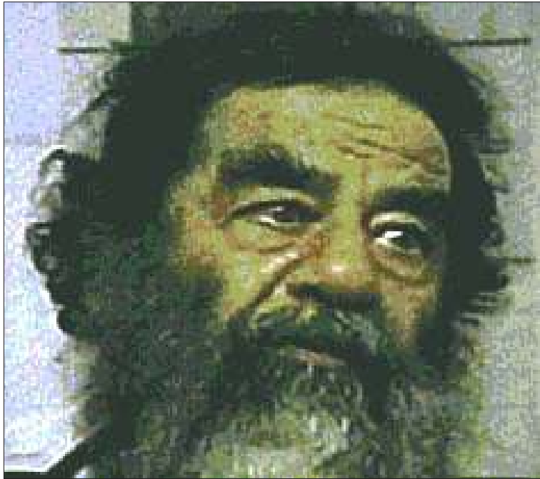
အီရတ်အာဏာရှင်ဟောင်း ဆက်ဒမ်ဟူစိန်

ဒီဇင်ဘာ၊ (၁၅)ရက်။ [စီအင်အန်အင်န်] ဒီဇင်ဘာ(၁၅)ရက်နေ့ညက ယခင် အီရတ်အာဏာရှင်ဟောင်း ဆက်ဒမ်ဟူစိန် အား ၎င်းပုန်းအောင်းနေသည့် တိကရစ်မြို့ အနီးတောင်ယာတဲတဲရီ မြေကျင်းထဲတွင် အမေရိကန်စစ်သားများက အရှင်ဖမ်းဆီး မိလိုက်သည်။