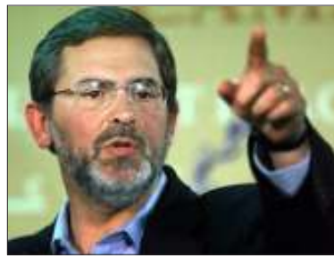
မစ္စတာ ရစ်ချတ်ဘောက်ချာ