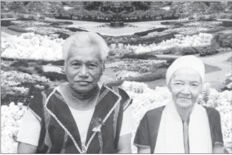
ဖူးနှင့်ဖီးတာမလာဖောတို့၏ အနှစ်(၆၀)မြောက် မင်္ဂလာသဘင်အမှတ်တရ။

အသက်(၈၃)နှစ်အရွယ်ရှိ ကေအဲန်အယ်လ်အေ စစ်ဦးစီးချုပ် ဗိုလ်ချုပ်ကြီး ဖူးတာမလာဖောနှင့် ဖီးတာမလာဖောတို့၏ အနှစ်(၆၀)မြောက်အခမ်းအနားကို ဆွေမျိုးမိတ်သင်္ဂဟများနှင့် သားသမီးမြေးမြစ်များ စုံညီစွာဖြင့် လွတ်မြောက်နယ်မြေတနေရာ၌ (၁၅-၁၀-၂၀၀၃)ရက်နေ့က ကျင်းပခဲ့ကြောင်း သိရှိရသည်။ ဗိုလ်ချုပ်ကြီးတို့ဇနီးမောင်နှံတွင် သားသမီး(၈)ဦး၊ မြေး(၃၁)ဦးနှင့် မြစ်(၁၁)ဦး ထွန်းကားခဲ့သည်။ သားကြီး ဗိုလ်မှူးချုပ်အားဂီ (ကေအဲန်အယ်လ်အေတပ်မဟာ-၂ တပ်မဟာမှူး)၊ ဗိုလ်မှူးချုပ်ပိလ (ကေအဲန်အယ်လ်အေ စစ်ရေးချုပ်)၊ သမီးကြီး နော်အားမူ (မူကြိုဆရာအတတ်ဆရာကြောင်း)၊ နော်လီပီ (အမျိုးသမီးသာသနာပြုဆရာမ)၊