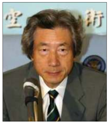
ဂျပန်ဝန်ကြီးချုပ် ကိုအိုဇီမိ

၁၉၉၀ ပြည့် ရွေး ကောက်ပွဲအိုင်ဂျစ် အန်အယ်လ်ဒီပီတီနှင့်တိုင်းရင်းသားလူမျိုးစုပါတီများအား အာဏာလွှဲအပ်ပေးခြင်း မရှိသမျှကာလပတ်လုံး မြန်မာနိုင်ငံကို ဂျပန်က အကူအညီပြန်လည်ပေးလိမ့် မည်မဟုတ်ဟု ဂျပန်ဝန်ကြီးချုပ်ကိုအိုဇီမိက နအဖဝန်ကြီးချုပ် ဗိုလ်ချုပ်ကြီးခင်ညွန့်ကို အတိအလင်း ပြောဆိုလိုက်ကြောင်း သိရသည်။