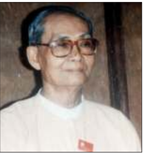
ဦးစိုးမြင့်

ဒီဇင်ဘာ (၁၅)ရက်။ နအဖ၏ အချက်(၇)ချက်ပါနိုင်ငံရေး လမ်းညွှန်အစီအစဉ်အရကျင်းပမည့် အမျိုး သားညီလာခံကို ရှေ့နှစ်(၂၀၀၄)တွင် စတင် ပြုလုပ်မည်ဖြစ်ပြီး ထိုညီလာခံသို့အမျိုးသား ဒီမိုကရေစီအဖွဲ့ချုပ်အပါအဝင် အတိုက်အခံ များအားလုံး တက်ရောက်ဆွဲပြုမည်ဖြစ်ကြောင်း နအဖ နိုင်ငံခြားရေးဝန်ကြီး၏ပြောကြား ချက်ကို မိမိတို့သိရှိရခြင်းမရှိသေးဟု အတိုက်အခံများက ပြောကြားခဲ့သည်။ နိုင်ငံပေါင်း ၁၂ နိုင်ငံတက်ရောက်သည့် မြန်မာ့အရေးဘန်ကောက်ဆွေးနွေးပွဲတွင် နအဖနိုင်ငံခြားရေးဝန်ကြီး ဦးဝင်းအောင်က နအဖကရေးဆွဲထားသည့် အချက် (၇)ချက် ပါ နိုင်ငံရေးလမ်းညွှန်အစီအစဉ်အရကျင်းပ မည့် အမျိုးသားညီလာခံကို ၂၀၀၄ ခုနှစ်တွင် စတင်ပြုလုပ်သွားမည်ဖြစ်ပြီး ထိုညီလာခံသို့ အဲဒီအယ်လ်ဒီအပါအဝင် အတိုက်အခံအဖွဲ့