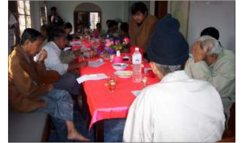
ပဉ္စမအကြိမ်မြောက် မဟာဗျူဟာညှိနှိုင်းအစည်းအဝေး ကျင်းပနေစဉ်

ပေါက်လာရေး၊ နိုင်ငံရေးပါတီများ လွတ် လပ်စွာ စည်းရုံးခွင့်များအပါအဝင် အခြေခံ ဒီမိုကရေစီအခွင့်အရေးများ ဖြစ်ပေါ်လာ ရေး ဖြစ်ထွန်းလာရေးနှင့် ဒီပဲယင်း အကြမ်း ဖက်မှု တရားမျှတစွာ ဖြေရှင်းရေးတည်း ဟူသောလုပ်ငန်းစဉ်များကို ချမှတ်ခဲ့ကြောင်း သိရသည်။ ဤညှိနှိုင်းအစည်းအဝေးသို့ KNPP၊ UNLD(LA)၊ WLB၊ NCGUB နှင့် NCUB တို့မှ ခေါင်းဆောင်များ စုံညီစွာ တက်ရောက်ခဲ့ကြသည်။ ❖