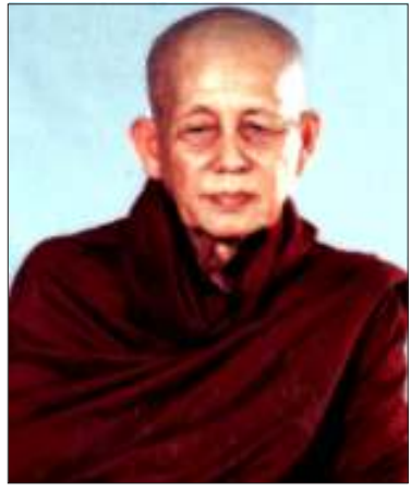
သာမညဆရာတော်ဘုရားကြီး