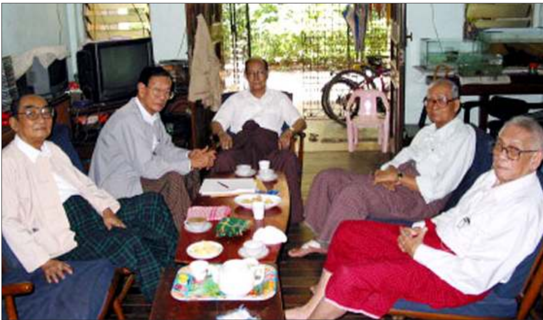
အဖွဲ့ချုပ်ဗဟိုအလုပ်အမှုဆောင်(၅)ဦး တွေ့ဆုံဆွေးနွေးညှိနှိုင်းနေစဉ်

အဖွဲ့ချုပ်ဗဟိုအလုပ်အမှုဆောင် (၅)ဦး တို့သည် ပြီးခဲ့သည့် နိုဝင်ဘာလကုန်ပိုင်းကမှ