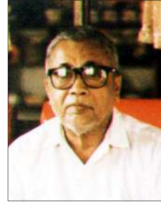
ပိုလ်မူးချုပ်ဟောင်း စိန်မြ (ကွယ်လွန်)

ယခုအချိန်တွင် ပီဒီအက်မ်သည် တပ်ပေါင်းစုလုပ်ငန်းများအောက်တွင် လူထုတိုက်ပွဲနှင့်လက်နက်ကိုင်တိုက်ပွဲ ဆက်စပ်နိုင်ရေးနှင့် ဖြစ်ပေါ်ပြောင်းလဲနေသော နိုင်ငံတကာအခြေအနေနှင့် ပြည်တွင်းအခြေအနေတို့အားဆုတ်ကိုင်၍ စစ်အာဏာရှင်စနစ် လုံးဝချုပ်ငြိမ်းရေးအတွက် မဆုတ်