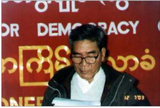
ညီလာခံအတွင်း ဒုဥက္ကဋ္ဌ ဦးတင်အောင် တင်ပြဆွေးနွေးစဉ်

အမျိုးသားဒီမိုကရေစီအဖွဲ့ချုပ် (လွတ်မြောက်နယ်မြေ)၏ စတုတ္ထအကြိမ်ညီလာခံကို ထိုင်း-မြန်မာနယ်စပ်တနေရာ၌ ဒီဇင်ဘာ (၇)ရက်နေ့မှ (၁၁)ရက်နေ့အထိ ကျင်းပခဲ့ကြောင်းသိရှိရသည်။