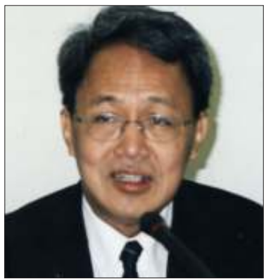
ဝန်ကြီးချုပ်ဒေါက်တာ စိန်ဝင်း

ဆက်လက်၍ နိုင်ငံတကာတွင် ပြုလုပ် ကောင်းရုံသက်သက်အဖြစ် နိုင်ငံရေး ဆွေး နွေးပွဲများ လုပ်နေပါပြီဟု နအဖက ပြော ဆိုနေသော်လည်း လူများကို ထောင်ထဲထည့် ပြီး ဆွေးနွေးနေခြင်းသာဖြစ်ကြောင်း၊ ထို့ ပြင် နိုင်ငံရေးအကျဉ်းသားများကိုလည်း ယနေ့အချိန်အထိ ပြန်လွှတ်ပေးခြင်းလည်း မရှိကြောင်း ပြောကြားလိုက်သည်။