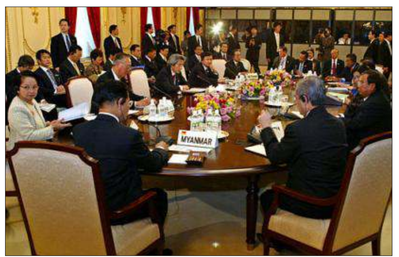
ဂျပန်-အာဆီယံ ပူးတွဲအစည်းအဝေးကျင်းပနေစဉ်

ရေးသဘောတူညီချက်အား ဖန်တီးရန် အလို့ငှာ ၂၀၀၅ ခုနှစ်အစောပိုင်းတွင် အရှေ့တောင်အာရှနိုင်ငံ (၁၀)နိုင်ငံစလုံးနှင့် လွတ်လပ်သည့်ကုန်သွယ်ရေးသဘောတူညီ ချက် ဆွေးနွေးပွဲစတင်ရန်လည်း ပြင်ဆင် နေသည်။ စိုက်ပျိုးရေးထွက်ကုန်တင်သွင်း ရေးသည် ဂျပန်အတွက် မကြာခင်ကိုနိုင်ငံ ကဲ့သို့ပင် ဤဆုံးနိုင်ငံနှင့်ကြုံတွေ့ရမည့် အကြီးမားဆုံး အတားအဆီးဖြစ်ဖို့များ ပေသည်။ ❖