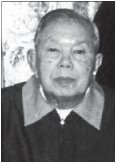
ပိုလ်မူးချုပ်ဟောင်း ကျော်ဇော