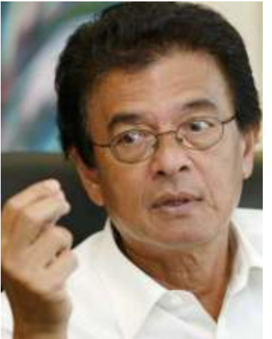
ကုလ အထူးကိုယ်စားလှယ် မစ္စတာ ရာဇာလီအစ္စမေးလ်

မြန်မာနိုင်ငံတွင် လူ့အခွင့်အရေးချိုးဖောက်မှုများသည် အရှေ့တောင်အာရှနိုင်ငံများ၏လုံခြုံရေးကို ခြိမ်းခြောက်လျက်ရှိပြီး ထိုအရေးကို ကုလသမဂ္ဂလုံခြုံရေးကောင်စီက ကြားဝင်ကိုင်တွယ်ဆောင်ရွက်ရန် အမေရိကန် ဆီးနိတ်(အထက်လွှတ်တော်)၏ ဆုံးဖြတ်ချက်