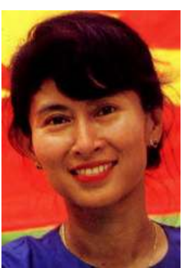
အာရှသုခကောင်း ဒေါ်အောင်ဆန်းစုကြည် မြန်မာ့ဒီမိုကရေစီအရေးကို အာရှနိုင်ငံများမှ ပြည်သူများက ပိုမိုစိတ်ဝင်စားအားပေးလာ နိုင်ဖွယ်ရှိကြောင်း၊ နိုင်ငံရေးလေ့လာသုံးသပ် နေသူတဦးက ဖိုးကြီးထို့ ပြောကြားခဲ့သည်။❖

ကျော်ကြားသူ(၂၀)ဦးတို့ကို Time မဂ္ဂဇင်း ပရိသတ်(၂၀၀၀)ကျော်တို့က အမည်စာရင်း တင်သွင်းခဲ့ကြရာ အိန္ဒိယဝန်ကြီးချုပ်အဖြစ် လက်ရှိတာဝန်ယူထားသည့် မန်မိုဟန်ဆင်၊ တောင်ကိုရီးယားသမ္မတဟောင်း ကင်းအေးဂျူ တရုတ်ပြည်၏ ပထမဆုံး အာကာသယာဉ်မှူး ယမ်လီဝေနှင့် ဖိလစ်ပိုင်သမ္မတဟောင်း ကို ရာဇန်အိုတို့အပြင် အာရှနိုင်ငံများမှ ထင်ရှားကျော်ကြားသောနိုင်ငံရေး ခေါင်းဆောင်များ၊ အားကစားသမားများ၊ စာနယ်ဇင်းသမားများ ပါဝင်ခဲ့ကြသည်။ ဒေါ်အောင်ဆန်းစုကြည်သည် ၂၀၀၃ခု ဖေ(၃၀) ဒီပဲယင်းအရေးအခင်းကာလမှစ၍ ယနေ့တိုင် နေအိမ်အကျယ်ချုပ်ကျခံနေရပြီး ငြိမ်းချမ်းရေးနိတည်(၃၀၀)ကျော်တို့အနက် ဖမ်းဆီးခြင်းခံထားရသည့် တဦးတည်းသော ငြိမ်းချမ်းရေးနိတည်ဆောင်ရွက် ဖြစ်သည်။ ယခုလို အာရှသုခကောင်းအဖြစ် ဒေါ်အောင်ဆန်းစုကြည် ရွေးချယ်ခံခဲ့ခြင်းကြောင့်