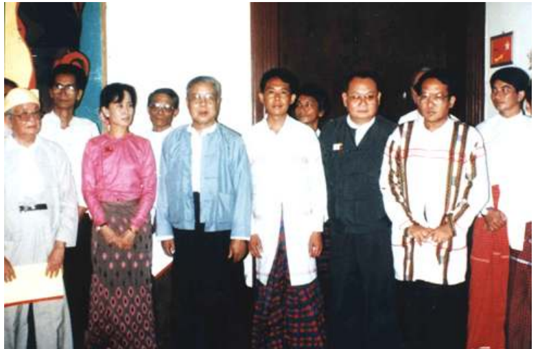
မြန်မာ့ဒီမိုကရေစီခေါင်းဆောင် ဒေါ်အောင်ဆန်းစုကြည်နှင့် တိုင်းရင်းသားခေါင်းဆောင်များအား အတူတကွတွေ့မြင်ရစဉ်

အဖွဲ့ချုပ်ခေါင်းဆောင်များ ဖြစ်သည့် ဒေါ်အောင်ဆန်းစုကြည် ဦးတင်ဦးနှင့် နိုင်ငံရေးအကျဉ်းသားများအားလုံးပြန်လည် လွတ်မြောက်ရေး၊ အဖွဲ့ချုပ်ရုံးများပြန်လည် ဖွင့်ခွင့်ရရှိရေးတို့အတွက် အမျိုးသားဒီမိုကရေစီအဖွဲ့ချုပ်ကပြုလုပ်နေသည့်လူထုဆန္ဒ လက်မှတ်ထိုးလှုပ်ရှားမှုကို တိုင်းရင်းသားနိုင်ငံရေးအင်အားစုကြီးဖြစ်သည့် ယူအန်အယ်ဒီက လက်မှတ်ရေးထိုးထောက်ခံလိုက်ကြောင်း သိရသည်။ စက်တင်ဘာ(၄)ရက်နေ့က စတင်၍