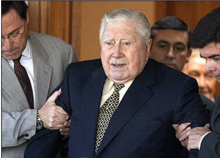
စစ်အာဏာရှင် ဗိုလ်ချုပ်ကြီးဟောင်း ဩဂတ်စတိုပီနိုချေး

ဤဆုံးဖြတ်ချက်က ၁၉၇၀ ခုနှစ်များနှင့် ၈၀ ခုနှစ်များက လူထုအား ရက်စက်စွာ ဖိနှိပ်မှုများအတွက် အသက်(၈၀) နှစ်ရှိပြီ ဖြစ်သည့် သမတဟောင်းအား တရားစွဲဆို ရန် လမ်းပွင့်ပေးလိုက်ခြင်းဖြစ်သည်။ ဤ သည်မှာ မေလက အောက်ရုံး၏စီရင်ချက်ကို အတည်ပြုလိုက်ခြင်းဖြစ်ပြီး တရားခံ၏ ဆွေမျိုးများက ဤဆုံးဖြတ်ချက်ကို ဩဘာ ပေးကြသည်။ ယခင်က အာဏာရှင်ကြီး ပီနို ချေးအား တရားစွဲဆိုရန်ကြိုးစားမှုမှာ မအောင်မြင်ဘဲ ဦးနှောက်ထိခိုက်ဒဏ်ရာ ကြောင့် စိတ်ဖောက်ပြန်နေသည့်အထဲတွင် ဆေးထောက်ခံချက်ဖြင့် ပယ်ချခြင်းခံနေရ သည်။ သို့သော် ဇူလိုင်လက အမေရိကန် အထက်လွှတ်တော်အစီရင်ခံစာတွင် ဒေါ်လာ သန်းပေါင်းများစွာရှိသည့် ပိုလ်ချုပ်ကြီး ဟောင်းပီနိုချေးပိုင်ဆိုင်သော အသေးစိတ်