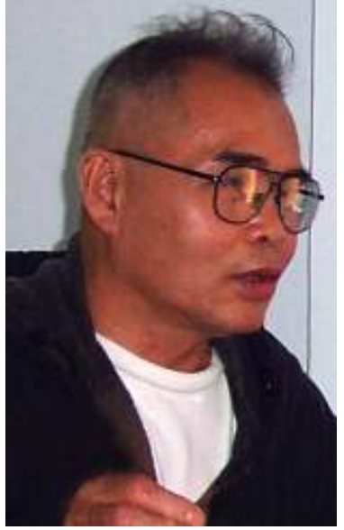
ကေအန်ယူ အထွေထွေအတွင်းရေးမှူး ပဒိုမန်းရှာ

စက်တင်ဘာလ၊ (၃၀)ရက်။ (FIG) စက်တင်ဘာ(၂၀)ရက် နံနက် ၅ နာရီ ခန့်က တနင်္သာရီတိုင်း ကော့သောင်ခရိုင် ဘုတ်ပြင်းမြို့နယ်တွင်းရှိ ကေအန်ယူစခန်း တခုနှင့် ကရင်ကျေးရွာတခုအား နအဖ စစ်တပ်က ဝင်ရောက်တိုက်ခိုက်ကာ ရွာအား