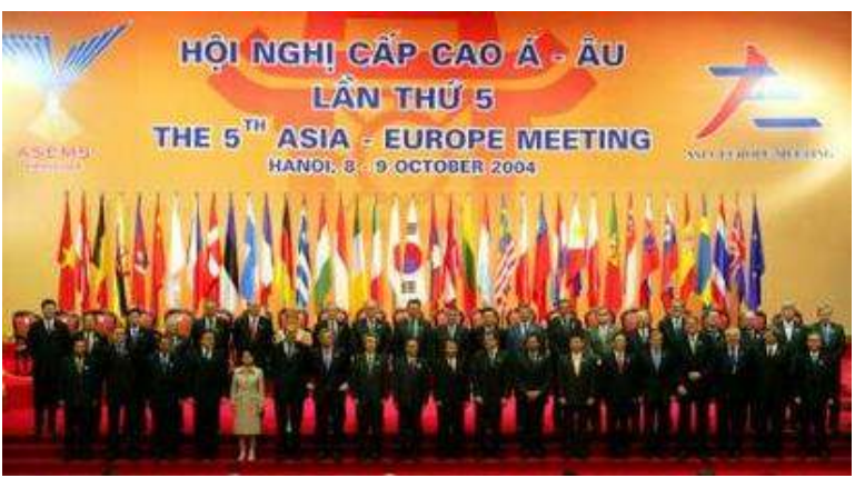
(၆)ကြိမ်မြောက် အီးယူ-အာဆီယံ (အာဆမ်) အစည်းအဝေးမှတ်တမ်းဓာတ်ပုံ

အောက်တိုဘာ။ (၁၀)ရက်။ အာဆမ်အစည်းအဝေးမတိုင်မီ မြန်မာ့ ဒီမိုကရေစီခေါင်းဆောင် ဒေါ်အောင်ဆန်း စုကြည်ကို အချိန်မီပြန်လွှတ်ပေးရန် အပါ အဝင် တောင်းဆိုချက်(၃)ရပ်ကို မလိုက်နာ သည့်အတွက် နအဖစစ်အုပ်စုအပေါ် စီးပွား ရေးပိတ်ဆို့မှု ထပ်မံတိုးမြှင့်လုပ်ဆောင်ရန် အီးယူအိုင်အိုအဖွဲ့ဝင်များက သဘော တူလိုက်ပြီဖြစ်ကြောင်း သိရသည်။