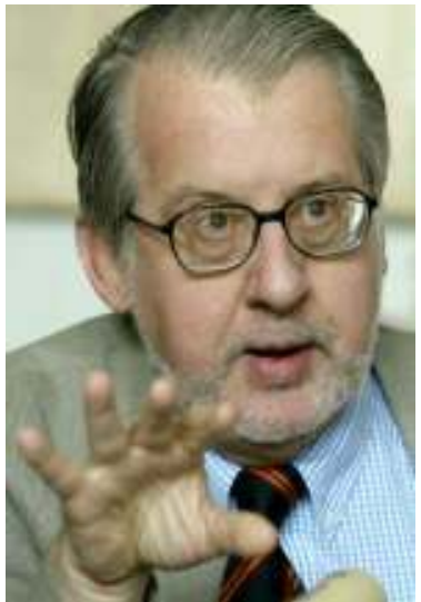
လူ့အခွင့်အရေးအထူး ကိုယ်စားလှယ် မစ္စတာ ပင်ဟေးရီး

နအဖစစ်အုပ်စုသည် နိုင်ငံရေးသမားကို အဆက်မပြတ်ဖမ်းဆီးကာ နှစ်ရှည်ထောင်ဒဏ်များချလျက်ရှိနေဆဲဖြစ်ကြောင်း မြန်မာနိုင်ငံဆိုင်ရာ ကုလသမဂ္ဂ လူ့အခွင့်အရေးအထူး ကိုယ်စားလှယ် မစ္စတာပင်ဟေးရီးက စက်