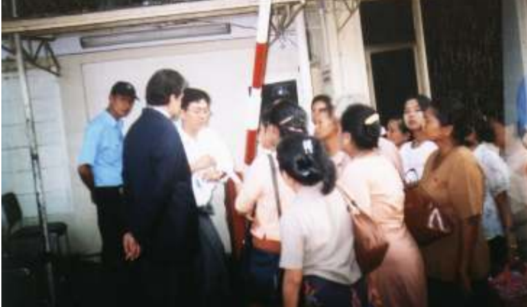
အဖွဲ့ချုပ်ဝင်အမျိုးသမီးအဖွဲ့ဝင်များ ယူအန်ဒီပီရုံးသို့ သွားရောက်နေကြစဉ်။ (အပေါ်ပုံ) ယူအန်ဒီပီရုံးတာဝန်ခံကိုတွေ့ဆုံ၍ တောင်းဆိုချက်များအားတင်ပြနေသည့် အမျိုးသမီးအဖွဲ့ဝင်များကိုတွေ့ရစဉ်။ (အောက်ပုံ)

ထိုသို့တောင်းဆိုချက်များတွင် နယူး ယောက်မြို့ ကုလသမဂ္ဂရုံးချုပ်ရှေ့တွင် မြန်မာ့ အရေးကို ကုလသမဂ္ဂလိုခြံရေးကောင်စီက အမြန်ဆုံးအရေးယူဆောင်ရွက်ပေးရန် အတွက် အစာငတ်ခံတိုက်ပွဲဝင်နေသူများ၏ ကျန်းမာရေးနှင့်အသက်အန္တရာယ်ကို စိုးရိမ် နေရသည့်အတွက် အဖွဲ့ချုပ်ပါတီဝင်များက ၎င်းတို့ကိုသွား ရောက်တွေ့ဆုံ၍ ဆွေးနွေး ရန်၊ ရွေးကောက်ပွဲနှစ်ပတ်လည်နေ့တွင် ထိုင်းနိုင်ငံ၌ဆန္ဒပြ၍ ဖမ်းဆီးခံနေရသူများ သည် ယနေ့အချိန်အထိ ပြန်လွှတ်ပေးခြင်း မရှိသည့်အတွက် ဆက်လက်ဆန္ဒပြနေသည့် အတွက် ကုလသမဂ္ဂအဖွဲ့က သွားရောက် ကြည့်ရှုရန်နှင့် ၁၉၉၀ ပြည့် ရွေးကောက်ပွဲ ရလဒ်ကို ကုလသမဂ္ဂက အသိအမှတ်ပြုပြီး ဖြစ်သည့်အတွက် ဆက်လက်အကောင်အထည် ဖော်သွားရန်တို့ကို တင်ပြခဲ့ကြကြောင်း သိရ သည်။ ထိုတောင်းဆိုချက်များအား ယူအန်ဒီပီ