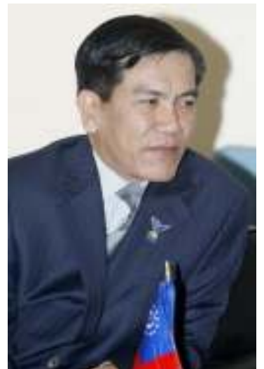
နအဖ နိုင်ငံခြားရေးဝန်ကြီးသစ် ဗိုလ်ချုပ်ဉာဏ်ဝင်း

နအဖစစ်အုပ်စုက ၎င်းတို့အာဏာ သိမ်းခဲ့သည့် (၁၆)နှစ်မြောက် နှစ်ပတ်လည် နေ့တွင် အစိုးရအဖွဲ့အတွင်း ရာထူးနေရာ အချို့ အပြောင်းအလဲပြုလုပ်ခဲ့ရာ နအဖ နိုင်ငံခြားရေးဝန်ကြီးနှင့် ဒုဝန်ကြီးတို့ ရာထူး မှနုတ်ပယ်ခြင်းခံရ လိုက်ကြောင်းသိရသည်။ ရာထူးမှဖယ်ရှားခြင်းခံရသည့် နိုင်ငံ ခြားရေးဝန်ကြီးဟောင်း ဦးဝင်းအောင်၏ နေရာတွင် တပ်မတော်လေ့ကျင့်ရေးဌာနမှ ဗိုလ်ချုပ်ဉာဏ်ဝင်းကို အစားထိုးလိုက်ပြီး ဒု ဝန်ကြီးချုပ်အဖြစ် ဗိုလ်မှူးကြီးမောင်မြင့်ကို ပြောင်းလဲလိုက်သည်။