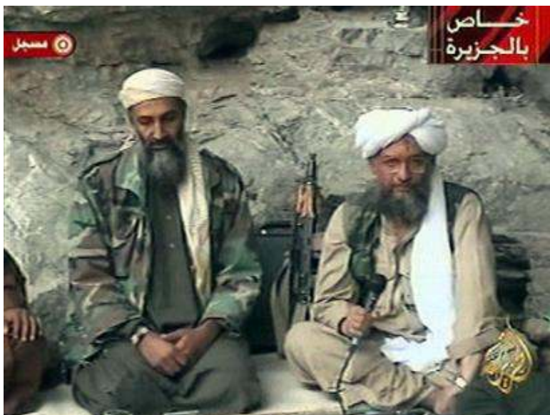
အိုမာဘင်လာဒင် နှင့် အိမ်နီးအယ်လ်ဇာဝါဟီဒီ