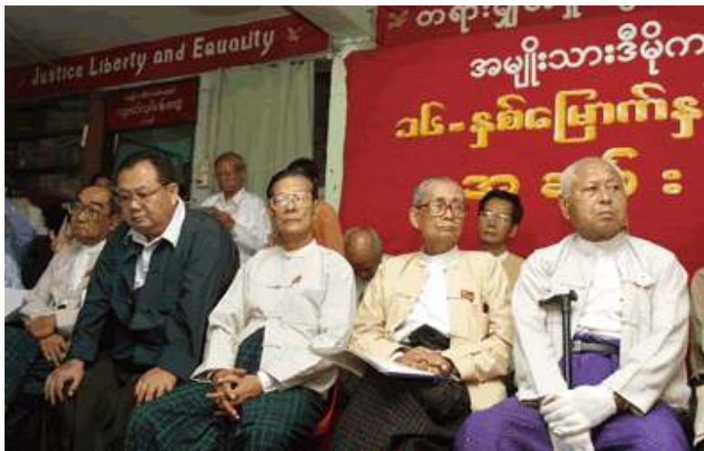
အခမ်းအနားတက်ရောက်လာသည့် နိုင်ငံရေးအင်အားစုများ

ကရင်တော်လှန်ရေး စတင်စဉ်ကတည်းကပါဝင်ခဲ့ပြီး ကျန်းမာရေးကြောင့် ယခင်နှစ်ကမှတာဝန်မှအနားယူခဲ့သူ ကရင်အမျိုးသားအဘိုးအိုက “အန်အယ်လ်ဒီဟာ တိုင်းရင်းသားလူမျိုးများအားလုံးအတွက် ဒီမိုကရေစီ