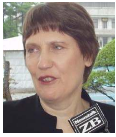
နယူးဇီလန်ဝန်ကြီးချုပ် ဟယ်လင်ကလပ်

ဝန်ကြီးချုပ်က စစ်အုပ်စုအနေဖြင့် နိုင်ငံတကာအလယ်တွင် ဂုဏ်သိက္ခာရှိရှိဖြင့် ရပ်တည်သွားနိုင်ရန်အတွက် ဒေါ်အောင်ဆန်းစုကြည်ကို ချက်ချင်းပြန်လွှတ်ပြီး တိုင်းရင်းသားခေါင်းဆောင်များပါ ပါဝင်သည့် တွေ့ဆုံဆွေးနွေးပွဲများကို အမြန်ဆုံးပြုလုပ်ရန် တိုက်တွန်းတောင်းဆိုလိုက်သည်။