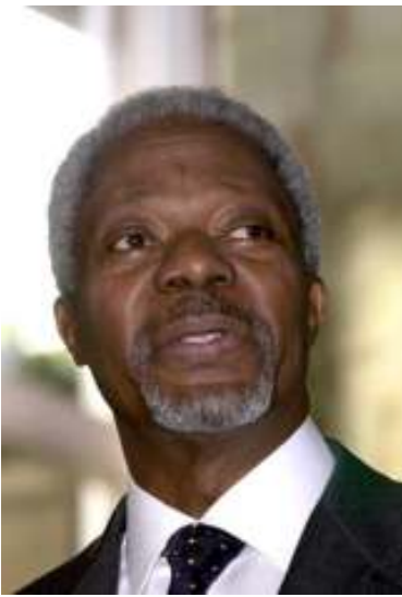
ကုလ အထွေထွေအတွင်းရေးမှူးချုပ် မစ္စတာ ကိုဖီအာနန်

ထိုအစည်းအဝေးသို့ အာဆီယံနိုင်ငံများဖြစ်ကြသည့် ထိုင်း၊ မလေးရှား၊ စင်္ကာပူ၊ အင်ဒိုနီးရှား၊ ဗီယက်နမ်တို့မှ အဆင့်မြင့် ကိုယ်စားလှယ်များနှင့် အမေရိကန်၊ ပြင်သစ်၊ ဗြိတိန်၊ နော်ဝေ၊ ဩစတြေးလျနှင့် အိန္ဒိယ