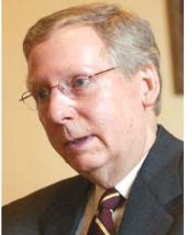
အထက်လွှတ်တော် အမတ် မစ်ချဲမက်ကောနယ်

လူ့အခွင့်အရေးချိုးဖောက်မှုများ ဆက်လက်ကျူးလွန်နေသည့် နအဖစစ်အုပ်စုသည် ဒေသတွင်းလုံခြုံရေးကို ခြိမ်းခြောက်လာနေ၍ ကုလသမဂ္ဂလုံခြုံရေးကောင်စီမှ အမြန်ဆုံး အရေးယူပေးရန် ဥပဒေမူကြမ်းတရပ်ကို အမေရိကန်အထက် အောက်လွှတ်တော်နှစ်ရပ်လုံးက အတည်ပြုလိုက်ပြီဖြစ်သည်။ ရိုဗင်ပလီကန် အထက်လွှတ်တော်အမတ် မစ်ချဲမက်ကောနယ်က နိုင်ငံတွင် ဆိုးရွားစွာဖြစ်ပေါ်နေသည့် အေအိုင်ဒီအက်စ် ရောဂါကို ထိရောက်စွာ မတားဆီးနိုင်ခြင်း၊ စစ်ဘေးများက အမျိုးသမီးများအား အဓမ္မပြုကျင့်ခွင့်ရရှိနေခြင်း၊ ဘိန်းဖြူနှင့် စိတ်ကြွဆေးများ ဆက်လက်ထုတ်လုပ်နေခြင်း၊ တိုင်းရင်းသားလူမျိုးစုများကို ဖိနှိပ်နေခြင်းနှင့် မြောက်ကိုရီးယားမှ နျူကလီးယားလက်နက်များဝယ်ယူရန် ကြိုးစားနေခြင်းစသည့် အချက်များကိုထောက်ပြ၍ အထက်လွှတ်တော်သို့ စက်တင်ဘာ(၂၀)ရက်နေ့က တင်သွင်းခဲ့ခြင်းဖြစ်သည်။