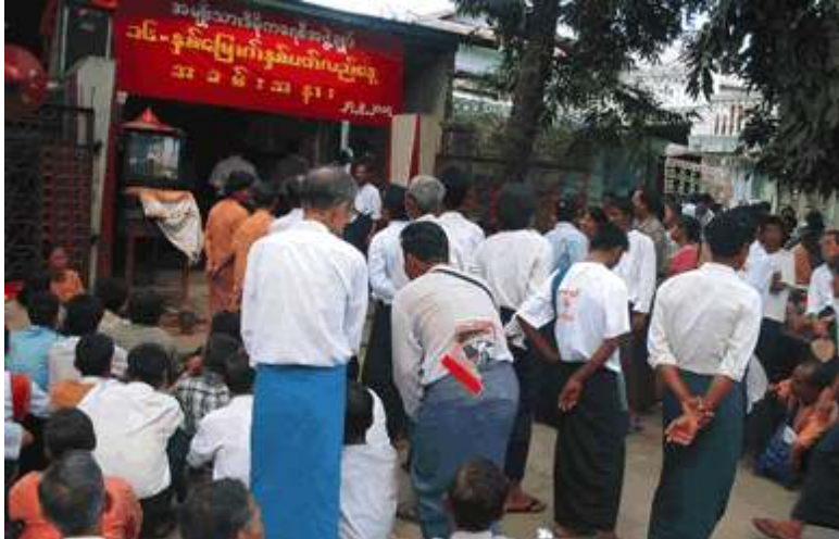
အခမ်းအနားမကျင်းပမီ တက်ရောက်လာသည့် အဖွဲ့ချုပ်ဝင်များအား တွေ့ရစဉ်

အန်အယ်လ်ဒီသည် ၁၉၉၀ ပြည့်ရွေးကောက်ပွဲတွင် မဲဆန္ဒနယ် (၄၀၅)နေရာ အနက်(၃၉၂)နေရာ အနိုင်ရခဲ့သော်လည်း ယခုအချိန်အထိ အာဏာလွှဲပြောင်းပေးရေးကို နအဖက မျက်ကွယ်ပြုလျက်ရှိသေးသည်။ ယခုကာလအတွင်း အန်အယ်လ်ဒီမဟာအလုပ်အမှုဆောင်နှင့် အောက်ခြေခေါင်းဆောင်များအကြား မူဝါဒပိုင်းဆိုင်ရာကွာဟမှု ပိုမိုကြီးမားလာကြောင်း သိရ၏။