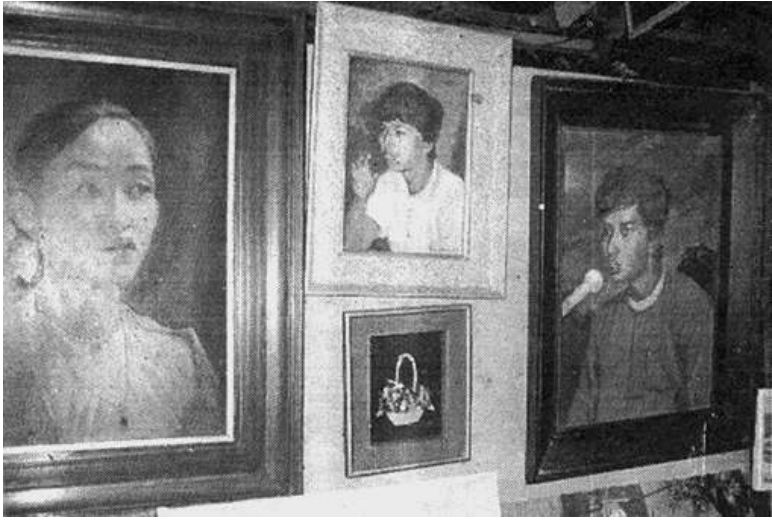
စက်တင်လာလထုတ် မြန်မာ့ဓနပဂ္ဂဇာတ်တွင်ပါရှိသည့် ကျောင်းသားခေါင်းဆောင် မင်းကိုနိုင်၏ပုံစံပြုသည့် ပန်းချီကားများ

ကျောင်းသားခေါင်းဆောင် ဗကသမား အဖွဲ့ချုပ်ဥက္ကဋ္ဌ မင်းကိုနိုင်၏ပုံစံပြုသည့် ပန်းချီကားများပါဝင်နေသည့်အတွက် လစဉ်ထုတ်မဂ္ဂဇာတ် ကြီးတစောင်ဖြစ်သည့် မြန်မာ့ဓနပဂ္ဂဇာတ်ကို သက်ဆိုင်ရာအာဏာပိုင်များက ထုတ်ဝေခွင့် ပိတ်ပင်လိုက်ကြောင်း သတင်းများပေါ်ထွက် လာခဲ့သည်။