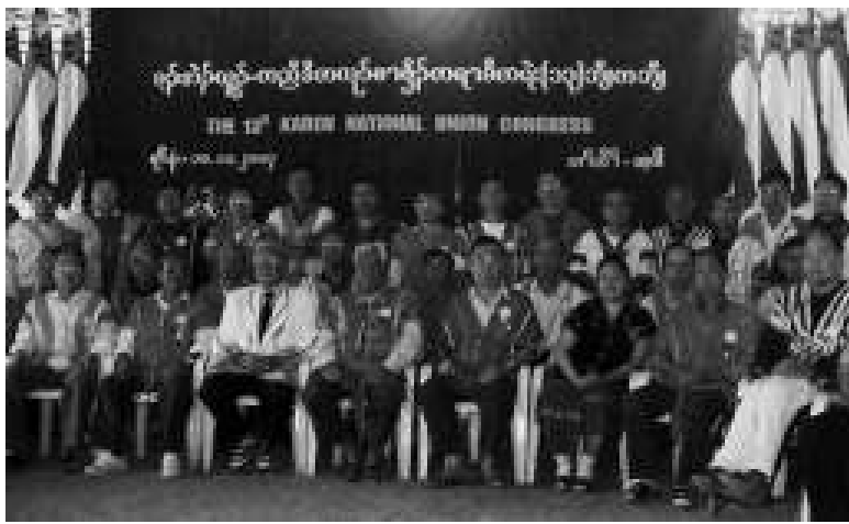
(၁၃)ကြိမ်မြောက် ကရင်အမျိုးသားအစည်းအရုံးညီလာခံကြီးအပြီး ကရင်အမျိုးသားခေါင်းဆောင်များအား တွေ့မြင်ရစဉ်။

ကရင်အမျိုးသားအစည်းအရုံးကြီး၏ (၁၃)ကြိမ်မြောက်ညီလာခံကို ကော်သူလေး ပြည်နယ်အတွင်းရှိ အခြေခံဒေသတနေရာ၌ ၂၀၀၄ ခုနှစ် နိုဝင်ဘာ (၁၀)ရက်နေ့မှ ဒီဇင်ဘာ (၁၀)ရက်နေ့အထိကျင်းပခဲ့ရာ ကိုယ်စားလှယ် ပေါင်း(၁၄၀)နှင့် လေ့လာသူ(၄၃)ဦး တက် ရောက်ကြပြီး၊ ကရင်အမျိုးသားများ၏ အမျိုးသားတန်းတူရေးနှင့် ကိုယ်ပိုင်ပြဌာန်းခွင့် ရရှိရေး၊ စစ်မှန်သော ဒီမိုကရေစီ ဖက်ဒရယ်ပြည်ထောင်စုတည်ဆောက်ရေးဟူသော အခြေခံ နိုင်ငံရေးဦးတည်ချက်များကိုချမှတ်