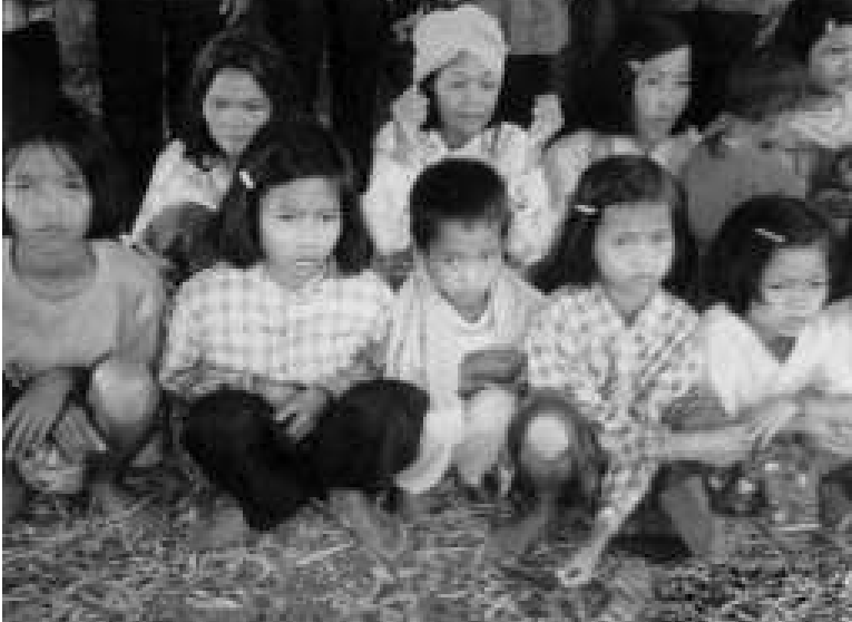
တောတွင်းဘဝမှ လွတ်မြောက်လာသည့် ခမာနီမိသားစုကို တွေ့မြင်ရစဉ်။

ယူမှုများပြုလုပ်ခဲ့ပြီး ဒေါ်လာတီလီယံ ၂၀ အထက်ငွေများကို တရားမဝင်ရယူခဲ့သည်။ စုံစမ်းစစ်ဆေးမှုများအဆိုအရ အမေရိကန် မဟာလုပ်ငန်းခွင်ကြီးများအပါအဝင် ပြင်သစ်၊ ရုရှား၊ တရုတ်အစား ရေနံကုမ္ပဏီကြီးများက ယင်းအရှုပ်အထွေးတွင်ပါဝင်ပတ်သက်နေပြီး ကုလသမဂ္ဂအရာရှိကြီးများပါ ပါဝင်နေ ကြောင်း သိရှိရသည်။ အထူးခြားဆုံးမှာ ကိုဖီအာနန်၏ သား ကိုဂျိုးသည် ဆွတ်ကမ္ပူကီ Contecna နှင့် ဆက်သွယ်လုပ်ကိုင်နေမှုကြောင့် ဝေဖန်ခြင်း ခံရခြင်းဖြစ်သည်။ ၁၉၉၀ ဒီဇင်ဘာမှ ၂၀၀၄ ခုနှစ်၊ ဖေဖော်ဝါရီလအထိ ကိုဂျိုးအား လစဉ် ဒေါ်လာ ၂,၅၀၀ ပေး၍ အတိုင်ပင်ခံအရာ ရှိအဖြစ်ခန့်ထားသည့် ယင်းကုမ္ပဏီသည် အီရတ်သို့ ကုန်ပစ္စည်းများတင်သွင်းခဲ့ ခဲ့သည့် အတွက် ကန့်သတ်ရရှိသည့် ကုမ္ပဏီဖြစ် သည်။ ကိုဖီအာနန်ကမူ သူက လွတ်လပ်တဲ့ စီးပွားရေးလုပ်ငန်းရှင်ပါ သူ့လုပ်ငန်းတွေမှာ ကျနော်ပါဝင်ပတ်သက်ခြင်းမရှိပါဘူးဟု ပြော ဆိုခဲ့သည်။