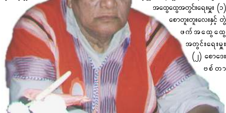
(၁၃)ကြိမ်မြောက် ကရင်အမျိုးသားအစည်းအရုံးညီလာခံကြီးမှ ရွေးချယ်တင်မြှောက်လိုက်သည့် ဒုတိယ ဥက္ကဋ္ဌ စောတာမလာဘော

ယင်းညီလာခံကြီးတွင် ဗဟိုကော်မတီ၏ နိုင်ငံရေးအစီရင်ခံစာ၊ လုပ်ငန်းအစီရင်ခံစာများကို အတည်ပြုနိုင်ခဲ့ပြီး ကေအန်ယူ၏ ဖွဲ့စည်းပုံအခြေခံဥပဒေနှင့် အခြေခံနိုင်ငံရေး စည်းရုံးရေးလမ်းစဉ်နှင့် ရှေ့လုပ်ငန်းစဉ်များကို တည်တည်တတည်း ချမှတ်ဆုံးဖြတ်ခဲ့သည်ဟု သိရသည်။ ယင်းညီလာခံကြီးမှ ဗဟိုကော်မတီဝင်(၃၀)ဦး၊ အရံဗဟိုကော်မတီဝင် (၁၅) ဦးနှင့် ဗဟိုအလုပ်အမှုဆောင်ကော်မတီဝင်(၁၁)ဦးကိုလည်းကောင်း၊ ရွေးချယ်တင်မြှောက်ခဲ့သည်။ ကေအန်ယူ ဥက္ကဋ္ဌ စောဘသင်စိန်၊ ဒုဥက္ကဋ္ဌ စောတာမလာဘော၊ အထွေထွေအတွင်းရေးမှူး မန်းရွှာလားဖန်၊ တွဲဖက် အထွေထွေအတွင်းရေးမှူး (၁) စောတူးတူးလေးနှင့် တွဲဖက် အထွေထွေ အတွင်းရေးမှူး (၂) စောဒေးဗစ် တာ