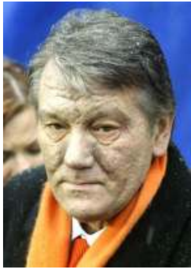
ယူကရိန်းအတိုက်အခံခေါင်းဆောင် Viktor Yushchenko

ရုပ်ပျက်ဆင်းပျက်ဖြစ်နေသော ယူကရိန်းအတိုက်အခံခေါင်းဆောင် Viktor Yushchenko ၏ မျက်နှာကို စစ်ဆေးပြီးနောက် သူသည်အဆိပ်ခါးရခြင်းဖြစ်ကြောင်း သြစတြေးလျရှိ ဝန်ထမ်းများက ဆေးရုံတစ်ခုတွင် စစ်ဆေးရာတွင် သက်သေအထောက်အထားများကို ဖော်ထုတ်တင်ပြသည်ဟု ဒီဇင်ဘာ ၂၀ ရက်နေ့ထုတ်တိုင်းမဂ္ဂဇင်းတွင် ဖော်ပြထားသည်။ ယူကရိန်းသမ္မတလောင်းဖြစ်သူ ယူရှီချန်ကို အား တတိယအကြိမ် ဆေးစစ်အပြီးတွင် သူ၏မိခင်ထံ၌ ခိုင်အောက်ဆင် (အဆိပ်ဖြစ်နိုင်သော ဓာတုပစ္စည်း)ပါဝင်မှု ပြင်းမားနေပြီး ပိုသတ်ဆေးနှင့် ပေါင်းသတ်ဆေးတစ်ခုမျိုး ဘေးထွက်အဆိပ်များ ပျံ့နှံ့နေကြောင်း ဗီယင်နာမြို့တော်မှ Ruddyincehaus ဆေးရုံမှ ဒါရိုက်တာ ဒေါက်တာ မိုက်ကယ်ဇင်မိက ထုတ်ဖော်ပြောကြားခဲ့သည်။ ယူရှီချန်ကိုသည် ဒီဇင်ဘာ ၂၆ ရက်တွင် ပြန်လည်ကျင်းပမည့် ရွေးကောက်ပွဲအသစ်တွင် ပါဝင်ယှဉ်ပြိုင်မည်ဖြစ်သည်။ သူ၏ ရောဂါကြောင့် သူ့အားထောက်ခံသူများအတွင်း ပိုမို၍အားကောင်းလာဖွယ်ရှိပြီး