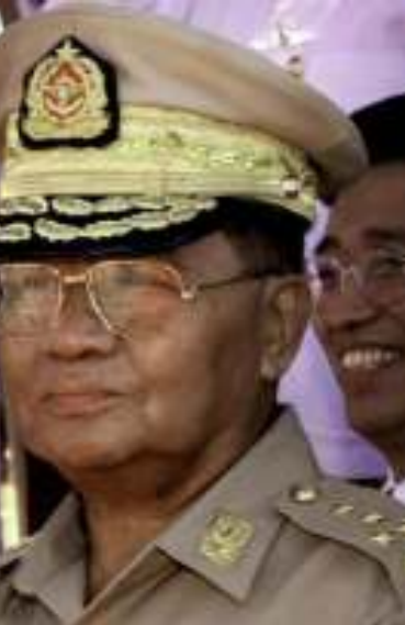
နအဖ စစ်အုပ်စုခေါင်းဆောင် ဗိုလ်ချုပ်မှူးကြီးသန်းရွှေ

မစ္စတာ တက်ခံစင်သည် ရန်ကုန်သို့ ရောက်ရှိနေစဉ် မြန်မာ့နိုင်ငံရေးအခြေအနေအပေါ် နိုင်ငံတကာ၏စိုးရိမ်ပူပန်မှုများကို နအဖ ခေါင်းဆောင်များအား ထုတ်ဖော်ပြောကြားခဲ့ကြောင်းနှင့် ဒီမိုကရေစီလုပ်ငန်းစဉ်ကိုအရှိန်မြှင့်လုပ်ဆောင်ရန် အလေးအနက် တိုက်တွန်းပြောကြားခဲ့ကြောင်းကိုလည်း ပြောဆိုသွားသည်။ နအဖ စစ်အုပ်စုခေါင်းဆောင်က ၎င်းတို့အနေဖြင့် မြန်မာ့နိုင်ငံရေးလမ်းပြ