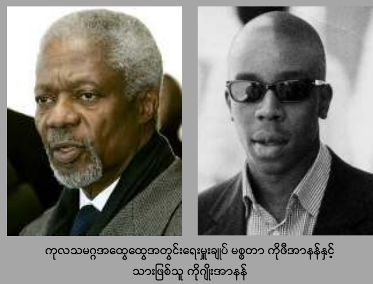
ကုလသမဂ္ဂအထွေထွေအတွင်းရေးမှူးချုပ် မစ္စတာ ကိုဖီအာနန်နှင့် သားဖြစ်သူ ကိုဂျိုးအာနန်

အမေရိကန်ပြည်ထောင်စု၊ မင်နီဆိုတာ ပြည်နယ် အထက်လွတ်တော်အမတ် ဆီနိတ် တာ နွမ်းကိုလ်မန်းက “ကိုဖီအာနန် နှစ် ဆယ့်ခြောက်နှစ်ကြာ တောပုန်းဘဝ” ဟု ပြောကြား ခဲ့သည်။ အမေရိကန်အဖွဲ့ဝင်တို့က မှတ်တမ်း တင်ရာတွင် ကိုဖီအာနန်အဖွဲ့ဝင်များသည် ဘာသာရေးအဖွဲ့ဝင်များနှင့် ပူးပေါင်းကာ ကိုဖီအာနန်အဖွဲ့ဝင်များကို ကာကွယ်ပေးခဲ့သည်။ အမေရိကန်အဖွဲ့ဝင်များသည် ကိုဖီအာနန်အဖွဲ့ဝင်များကို ကာကွယ်ပေးခဲ့သည်။ အမေရိကန်အဖွဲ့ဝင်များသည် ကိုဖီအာနန်အဖွဲ့ဝင်များကို ကာကွယ်ပေးခဲ့သည်။