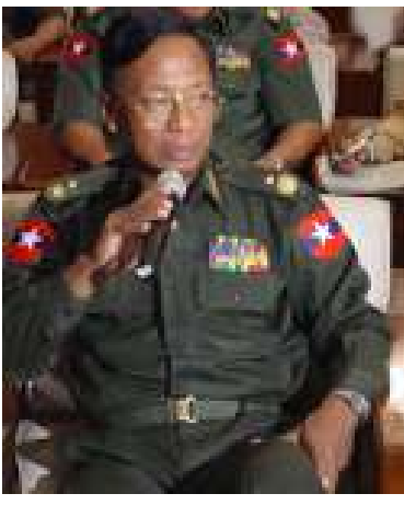
နအဖ စစ်ထောက်လှမ်းရေးအကြီးအကဲ ဒုတိယ ဗိုလ်ချုပ်ကြီးကျော်ဝင်း

ဖယ်ရှားခံခဲ့ရပြီး ကျန်သူများကို မူလမိခင် တပ်ရင်းအသီးသီး၌ တာဝန်ပြန်လည်ထမ်းဆောင်ရန် ညွှန်ကြားထားသည်ဟု ဆိုသည်။ ထို့အပြင် ယခင်စစ်ထောက်လှမ်းရေးဌာနကို လည်း ‘တပ်မတော်ရေးရာ လုံခြုံရေးညွှန်ကြားရေးမှူးရုံး’အဖြစ် အမည်ပြောင်းလိုက်သည်ဟု ဆိုသည်။