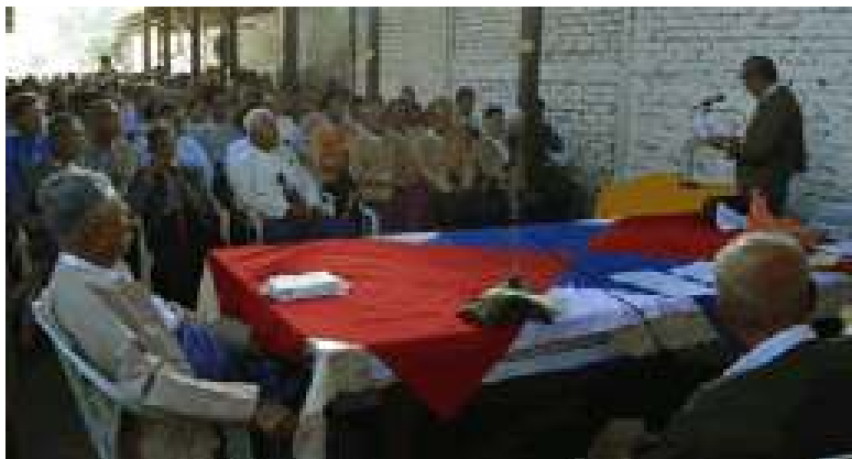
(၈၄)ကြိမ်မြောက် အမျိုးသားအောင်ပွဲနေ့ အခမ်းအနားကို ဝါရင့်နိုင်ငံရေးလုပ်ငန်းကော်မရှင်များက ကြီးမားကျင်းပစဉ်။

တည်းမှာပင် နိုင်ငံရေးအကျဉ်းသားအားလုံး ချွင်းချက်မရှိ လွှတ်ပေးရေး၊ ဒေါ်စုနှင့် ဦးတင်ဦးအား ချွင်းချက်မရှိလွှတ်ပေးရေး၊ အဲဒီအလယ်အလတ်အဖွဲ့များ ပြန်လည်ဖွင့်လှစ်ပေးရေးနှင့် လူမျိုးစု အင်အားစုပါတီအဖွဲ့အစည်းများနှင့် အဲဒီအလယ်အလတ်၏ စည်းရုံးလှုပ်ရှားခွင့်များ ပြန်လည်ပေးအပ်ပါရန် နအဖသို့ ယင်းထုတ်ပြန်ကြေညာချက်တွင် တောင်းဆိုထားသည်။