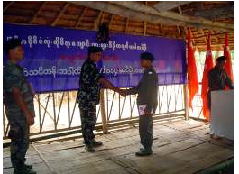
မြန်မာနိုင်ငံလုံးဆိုင်ရာ ကျောင်းသားများဒီမိုကရက်တစ်တပ်ဦး (မကဒတ) ကျောင်းသားတပ်မတော်၏ တပ်မတော်သင်တန်း အပတ်စဉ် (၃/၂၀၀၄) သင်တန်းဆင်းပွဲ အခမ်းအနားကျင်းပစဉ်

(၈၄) ကြိမ်မြောက် အမျိုးသားအောင်ပွဲနေ့ အထိမ်းအမှတ်အဖြစ် ဝါရင့်နိုင်ငံရေးလုပ်ငန်းကော်မရှင်များသည် (၄)မျက်နှာပါ သဘောထားနှင့် မေတ္တာရပ်ခံလွှာကို ထုတ်ပြန်ခဲ့သည်။ ဒေါ်အောင်ဆန်းစုကြည် ခေါင်းဆောင်သော အဲဒီအလယ်အလတ် တွေ့ဆုံဆွေးနွေးရေးကို မပြစ်မနေဆောင်ရွက်ရန် နအဖ ဥက္ကဋ္ဌထံသို့ မေတ္တာရပ်ခံလွှာ တဆက်