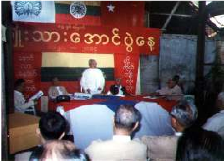
(၈၄)ကြိမ်မြောက် အမျိုးသားအောင်ပွဲနေ့ အခမ်းအနားကို ဝါရင့်နိုင်ငံရေးလုပ်ငန်းကော်မရှင်များက ကြီးမားကျင်းပစဉ်။

၁၃၃၆ခုနှစ် တန်ဆောင်မုန်းလပြည့်ကျော်(၁၀)ရက်၊ ၂၀၀၄ ခုနှစ် ဒီဇင်ဘာ (၆) ရက်နေ့တွင်ကျရောက်သော (၈၄)ကြိမ်မြောက် အမျိုးသားအောင်ပွဲနေ့ အခမ်းအနားများကို အဲဒီအလယ်အလတ် ဝါရင့်နိုင်ငံရေးလုပ်ငန်းကော်မရှင်များမှ အသီးသီးကျင်းပခဲ့ကြောင်း သိရသည်။