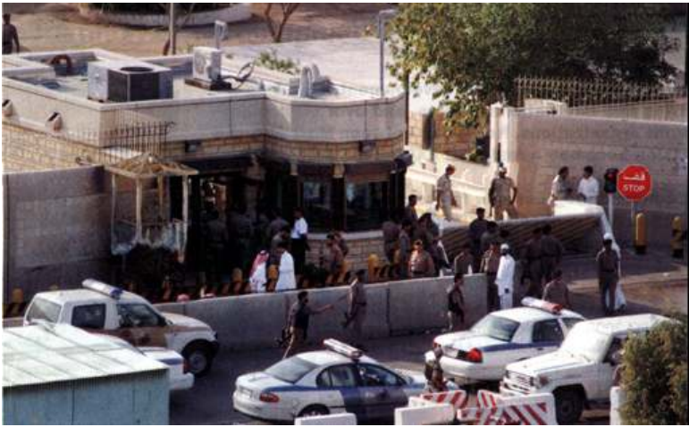
ဆော်ဒီအာရေဗျနိုင်ငံ၊ ဂျီဒတ်ဂျီ အမေရိကန်ကောင်စစ်ဝန်ရုံးအား အကြမ်းဖက်ကွန်မန်ဒိုအဖွဲ့မှ ဝင်ရောက်စိုးနင်းအပြီး တွေ့မြင်ရစဉ်။

အယ်လ်ကိုင်ဒါ မှတ်စလင် အကြမ်းဖက် ဝန်ရုံးအား (၅)ဦးပါ အကြမ်းဖက် ကွန်မန်ဒို အဖွဲ့တဖွဲ့မှ ဝင်ရောက်စိုးနင်းရာ တတိယ လာဒင်၏ ဇာတိမြို့ဖြစ်သည့် ဆော်ဒီအာရေ ဗျနိုင်ငံ၊ ဂျီဒတ်ဂျီ အမေရိကန်ကောင်စစ်