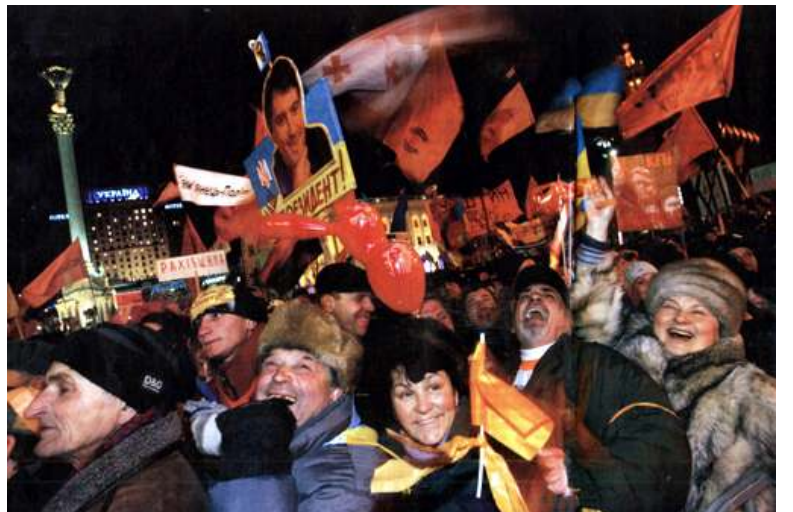
ယူကရိန်းအတိုက်အခံခေါင်းဆောင်ကို ထောက်ခံသူများအားတွေ့မြင်ရစဉ်

ယူကရိန်းနိုင်ငံ၏ စတုတ္ထအကြိမ်မြောက် သမ္မတရွေးကောက်ပွဲကို သက္ကရာဇ် ၂၀၀၄ ခုနှစ်၊ နိုဝင်ဘာလ ၂၁ ရက်နေ့၌ ကျင်းပခဲ့ရာ မူလဝန်ကြီးချုပ်ဟောင်း Yanukovich က မဲဆန္ဒခွဲစုစုပေါင်း ၃% အသာဖြင့် အနိုင်ရမည်ဟု ရွေးကောက်ပွဲကော်မရှင်မှကြေညာခဲ့သည်။ တပြိုင်တည်းမှာပင် ယူကရိန်းနှင့် နိုင်ငံခြားစောင့်ကြည့်လေ့လာသူများထံမှ မကျေနပ်ကန့်ကွက်ချက်များ အကျယ်အပြန့်ပေါ်ထွက်လာပြီး မဲဆန္ဒရှင်များ၏ ခြိမ်းခြောက်မှုများ၊ ပုဂ္ဂိုလ်ရေးတိုက်ခိုက်မှုများနှင့် မဲပုံးများအား မီးရှို့မှုများဖြစ်ပေါ်လာခဲ့သည်။ Yanukovich အား ထောက်ခံအားပေးလျက် မဲဆွယ်ပေးနေသည့် နိုင်ငံပိုင်သတင်းဌာနမှ ကြီးမားသော ဆူပူမှုများ မရှိဟု ကြေညာခဲ့သည်။ ထိုအချိန်မှာပင် အနောက်တိုင်းပုံစံ ပြုပြင်ပြောင်းလဲရေးလိုလားသူ အတိုက်အခံခေါင်းဆောင် Viktor Yushchenko အား ထောက်ခံအားပေးသည့် လူထုကြီးသည် Kiev မြို့တော်၏ လွတ်လပ်ရေးရင်ပြင်တွင်စုရုံးနေကြပြီး သူတို့၏ အမတ်လောင်းများ အနိုင်ရကြောင်း အသိအမှတ်ပြုရန် တောင်းဆိုကြသည်။ ယင်းသို့ လူထုစုစည်းမှုများက တစ်ထက်တစ်ကြီးမားလာပြီး Kiev မြို့သူမြို့သားများကပါ တခဲနက်ပူးပေါင်းပါဝင်လာကြသည်။ မကျေနပ်ဖြစ်နေသော ပုလိပ်အရာရှိများကလည်း လူထုဆန္ဒပြပွဲကို ပူးပေါင်းလာကြမည်ဟု ဆိုသည်။ လူထုကြီးသည် Yushchenko ၏ ယူကရိန်းပါတီ အထိမ်းအမှတ် လိမ္မော်ရောင် ဝတ်စုံ