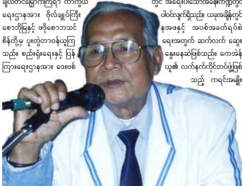
(၁၃)ကြိမ်မြောက် ကရင်အမျိုးသားအစည်းအရုံးညီလာခံကြီးမှ ပြန်လည်ရွေးချယ်တင်မြှောက်ခြင်းခံရသည့် ဥက္ကဋ္ဌ စောဘသင်စိန်

ဂျာခင်၊ နော်စီဖိုးရာစိန်၊ စောလှဟင်နရီတို့ မှာ CEC အဖြစ်တာဝန်ယူရသဖြင့် ကေအန်ယူ၏ လုပ်ငန်းများ ပိုမိုဆောင်ရွက်နိုင်ရန်အတွက် ဗဟိုအဖွဲ့အစည်းအဖွဲ့အား အမျိုးသမီးနှင့် လူငယ်ကိုယ်စားပြုခေါင်းဆောင်များ ထိပ်ပိုင်း မူဝါဒရေးရာ ဆုံးဖြတ်ပိုင်ခွင့်ရှိသည့် အဖွဲ့တွင် ပါဝင်လာသဖြင့် ကေအန်ယူနှင့် ညီညွတ်ရေး ပိုမိုအားကောင်းလာဖွယ်ရှိကြောင်း အကဲခတ် တဦးက ဖိုးကြီးသို့ ထုတ်ဖော်ပြောဆိုသည်။ ကေအန်ယူ၏ လုပ်ငန်းဌာနအသီးသီးကို ရွေးချယ်တင်မြှောက်ကြရာ ကာကွယ်ရေးဌာနအား ဗိုလ်ချုပ်ကြီး စောဘိုမြနှင့် ဖဒိုစောဘသင်စိန်တို့မှ ပူးတွဲတာဝန်ယူကြသည်။ စည်းရုံးရေးနှင့် ပြန်ကြားရေးဌာနအား ဒေးဗစ်