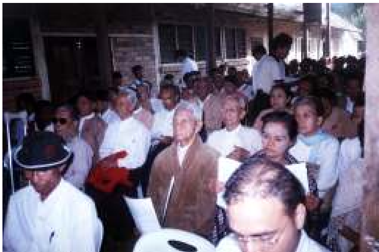
(၈၄)ကြိမ်မြောက် အမျိုးသားအောင်ပွဲနေ့ အခမ်းအနားသို့ တက်ရောက်လာသူများကို တွေ့မြင်ရစဉ်

အဆိုပါသင်တန်းများမှ အရာရှိငယ် စုစုပေါင်း ၂၀၀ ကျော်ကို မွေးထုတ်ခဲ့ပြီးဖြစ်