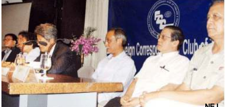
အရှေ့တောင်အာရှနိုင်ငံများမှ မြန်မာ့အရေးစိတ်ဝင်စားသူ လွှတ်တော်ကိုယ်စားလှယ်များ

ခြားရေးဝန်ကြီးဌာနသို့ မြန်မာနိုင်ငံသို့ ကိုယ်စားလှယ်အဖွဲ့စေလွှတ်နိုင်ရေးနှင့် ပတ်သက်၍ စာရေးအကြောင်းကြားမည်ဖြစ်ပြီး၊ ဒေါ်အောင်ဆန်းစုကြည်လွှတ်မြောက်ရေး၊ နအဖ အမျိုးသားဒီမိုကရေစီအဖွဲ့ချုပ်နှင့် တိုင်းရင်းသားအဖွဲ့များအကြား သုံးပွင့်ဆိုင်ဆွေးနွေးပွဲ ပေါ်ပေါက်လာအောင် နအဖကို တောင်းဆိုသွားမည်ဟု သိရသည်။