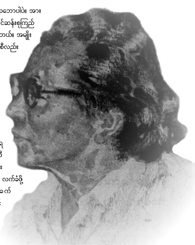
နိုင်ငံရေးလုပ်တာ တချို့က အာဏာရရေးလို့ ထင်နေတယ်။ မဟုတ်ဘူးဗျာ။ အာဏာရရေး တခုတည်းမဟုတ်ဘူး။

ရေးရနေတဲ့ သဘောပါပဲ။ အားလုံး ဒေါ်အောင်ဆန်းစုကြည်လည်း လက်ခံတယ်။ အမျိုးသားဒီမိုကရေစီလည်း ထောက်ခံကြတယ် ။ ပြည်တွင်း ပြည်ပက နေ။ သို့သော် တာဝန်ရှိတဲ့ အစိုးရဘက်က အဲဒီညီညွတ်ရေးကို သူ့အနေနဲ့ လက်ခံဖို့ တော်တော်ခက် နေမယ်ဆိုရင် အခုတောင် ဘာမှ စကားလည်း မပြန်