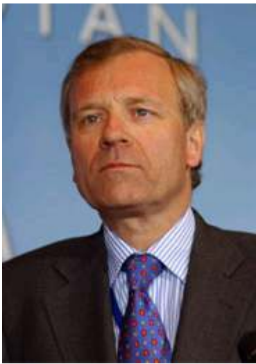
နေတိုးအတွင်းရေးမှူးချုပ် ဂျက်ဒီဟာ ရက်ဟား

နေတိုးအတွင်းရေးမှူးချုပ် ဂျက်ဒီဟာ ရက်ဟားသည် အစွဲအမူးသုံးစွဲရောင်းချမှုကို လျှော့ချရန် နှစ်ဖက်စစ်ရေးပူးပေါင်းဆောင်ရွက်မှုများ တိုးမြှင့်ရန်ဆွေးနွေးခဲ့ကြသည်။ သို့သော် လာမည့်အနာဂတ်တွင် အစွဲအမူးအခြေခံ အား နေတိုးအဖွဲ့ဝင်ဖြစ်လာမည့်အလား အလာကိုမူ ထည့်သွင်းဆွေးနွေးခြင်းမပြုချေ။ ဤစွဲအမူးအခြေခံ (၂၆)နိုင်ငံ နေတိုးမဟာမိတ် အဖွဲ့တွင် ပူးပေါင်းပါဝင်ရန် စိတ်ဝင်စားမှုပြဆိုခဲ့သည်။ သို့သော် မစ္စတာ ဟာဂျက်ဟားက ဤစိတ်ကူးသည် အာရပ်နိုင်ငံများနှင့် ရန်ဘက်ဖြစ်လိမ့်မည်ဆိုခြင်းကို အစွဲအမူးအား ရှင်းလင်းလင်းလင်း ပြောကြားခဲ့သည်။ အရှေ့အလယ်ပိုင်းဒေသဒေသများနှင့် အဖွဲ့ဝင်များ နေတိုးအဖွဲ့ဝင် ဖြစ်လာရန် နေတိုးအဖွဲ့ဝင် ဖြစ်ခြင်း ငြိမ်းချမ်းရေး ထိန်းသိမ်းရေးအဖွဲ့ဝင်များ စေလွှတ်ရေးကို စဉ်းစားမည်ဟု ပြောဆိုခဲ့သည်။ မစ္စတာ ဟာဂျက်ဟား၏လုပ်ပုံသည် နေတိုးနှင့် အစွဲအမူးအကြား ဆက်ဆံရေးတိုးမြှင့်လာကြောင်း ပြသသည့်အနေအထားလည်းဖြစ်သည်။ နှစ်ဖက်စလုံးသည် စစ်ရေးပူးတွဲလေ့ကျင့်မှုများ လုပ်ဆောင်ကြပြီး ထောက်ပံ့ရေး ဝန်ထမ်းများ ဖလှယ်ခြင်းနှင့် လူအများ သေကြေပျက်စီးနိုင်သည့်လက်နက်များ မပြန့်ပွားရေးစသည့်ကိစ္စများတွင် ပူးပေါင်းဆောင်ရွက်မှုကို တိုးမြှင့်လုပ်ဆောင်ရန် စိတ်ဝင်စားကြသည်။ အစွဲအမူးအခြေခံအား ဟာဂျက်နှင့် တွေ့ဆုံမေးမြန်းမှုတွင် အစွဲအမူးအခြေခံအဖွဲ့အစည်းအလယ်ပိုင်းဒေသဒေသများနှင့် ဆွေးနွေးရာ၌ ဒေသတွင်းရှိဖြစ်ပျက်နေသည့် ထိလွယ်မှု