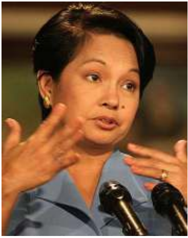
ဖိလစ်ပိုင်သမ္မတ Ms. Gloria Arroyo

ဒေါ်အောင်ဆန်းစုကြည်အား ပြန်လွှတ်ပေးရန် ဖိလစ်ပိုင်သမ္မတ Ms. Gloria Arroyo က ဖေဖော်ဝါရီလ (၂၁) ရက်နေ့က တောင်းဆိုလိုက်သည်။ နအဖ ဝန်ကြီးချုပ် ဒုဗိုလ်ချုပ်ကြီးဖိုးဝင်း၏ (၂) ရက်ကြာ ဖိလစ်ပိုင်ခရီးစဉ်တွင် Ms. Arroyo က ယင်းသို့ တောင်းဆိုလိုက်ခြင်း ဖြစ်သည်။