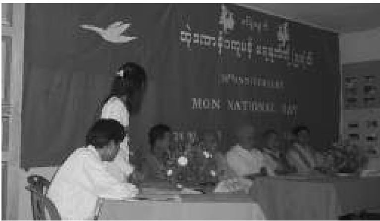
(၅၈)ကြိမ်မြောက် မွန်အမျိုးသားနေ့အခမ်းအနားကို ကျင်းပနေစဉ် မြင်ကွင်း

(၅၈)ကြိမ်မြောက် မွန်အမျိုးသားနေ့ အခမ်းအနားကို ကျောင်းသားလူငယ်များ ကွန်ဂရက် (မြန်မာနိုင်ငံ)ရုံး၌ ဖေဖော်ဝါရီလ (၂၄) ရက်နေ့က ကျင်းပရ အဖွဲ့အစည်း