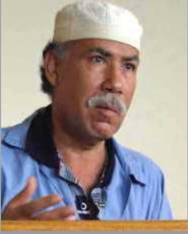
ဆက်ဒမ်ဟူစိန်၏ညီဖြစ်သူ အယ်လ်ဟာဆမ် အယ်လ်တီကရ်

အီရတ် လက်နက်ကိုင်ဆန်ကျွန်ုပ်တို့များ အား အဓိကဘဏ္ဍာရေးထောက်ပံ့နေသူဟု သံသယရှိသူ ဆက်ဒမ်ဟူစိန်၏ညီဖြစ်သူ ဆက်ဒမ်အာဘာဟင် အယ်လ်ဟာဆမ်အယ်လ်တီကရ်အား ဖမ်းဆီးရမိကြောင်း အီရတ် အစိုးရက ဖေဖော်ဝါရီ (၂၇)ရက်နေ့က ကြေညာလိုက်သည်။ ၎င်းသည် အမေရိကန်အစိုးရ အလိုချင်ဆုံး အီရတ် (၅၅)ဦးထဲတွင် နံပါတ် (၃၆)ယောက်မြောက်ဖြစ်ပြီး ယခင်ဆက်ဒမ်ဟူစိန်လက်ထက်က ပြည်တွင်းထောက်လှမ်းရေးဌာနနှင့် လုံခြုံရေးဌာန၏ ခေါင်းဆောင်တဦးလည်းဖြစ်သည်။ ၎င်းသည် ဆိုဒါးယား၌ ခိုလှုံနေပြီး အီရတ်ရှိ ပြောက်ကျားအဖွဲ့များအား ငွေအမြောက်အမြားထောက်ပံ့နေသူဟု ယုံကြည်ရပြီး လွန်ခဲ့သည့်ပတ်ကျော်က ဆီးရီးယားအစိုးရက အခြားသူလွန်ဖြစ်သူဟု ဆိုသည့် (၂၉)ဦးနှင့်အတူ ဖမ်းဆီးခဲ့ပြီး အီရတ်အစိုးရသို့ လွှဲပြောင်းပေးအပ်ခဲ့သည်ဟု အေအက်ပီသတင်းဌာနက ပြောဆိုခဲ့သည်။