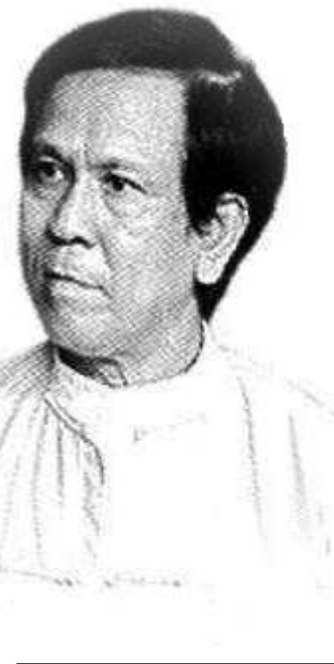
စာမျက်နှာ (၁၄) ကော်လံ (၁) သို့...

ဖြေရှင်းသင့်ပါတယ်။ ဒီနေရာမှာ ထပ်ပြီးပြောလိုတာက တိုင်းရင်းသားပါတီများအား လုံးရဲ့ဆန္ဒကတော့ တိုင်းရင်းသားပြဿနာကိုဖြေရှင်းမယ်ဆိုရင် ဒီမိုကရေစီကျပြီး ပိုမိုကျယ်ပြန့်တဲ့ညီလာခံတရပ်မှာ ဆွေးနွေးညှိနှိုင်း ဖြေရှင်းသင့်တယ်။ ဒီလိုဆွေးနွေးညှိနှိုင်းလို့ရလာတဲ့ အခြေခံအကြောင်းတရားတွေပေါ်မှာ စစ်မှန်တဲ့ ပြည်ထောင်စုကြီးကို တည်ဆောက်လိုကြတဲ့ ဆန္ဒများရှိကြပါတယ်။ ဒါဟာ ကောင်းမွန်တဲ့ သဘောထားတွေဖြစ်ပါတယ်။ ဒါနဲ့ပတ်သက်လို့ ကျနော် အကြံပြုချင်တာကတော့ တိုင်းရင်းသားလူမျိုးများပြဿနာကို အပေါ်ယံသဘော အပြောသက်သက်နဲ့ မပြီးနိုင်ပါ။ လက်တွေ့ကျကျ ဖြေရှင်းဖို့လိုပါတယ်။ အထူးသဖြင့် ပြဿနာကိုဖြေရှင်းဆုံးသပ်ရာမှာ ဆန္ဒစွဲလူမျိုး စွဲကင်းဖို့ လိုပါတယ်။