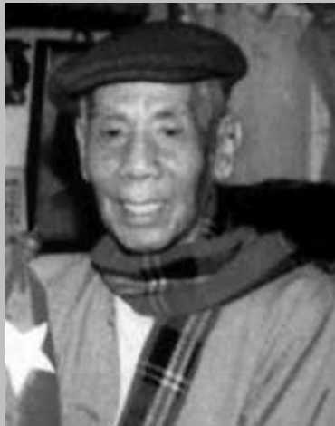
ဝါရင့်နိုင်ငံရေးသမားကြီး ဝိရုသခင်ချစ်မောင် ကြော်အတိုင်း ရပ်တည်ခဲ့သည်။

ဝိရုသခင်ချစ်မောင်၏ တစ်စိတ်မတ်မတ် ရပ်တည်ခဲ့သော လမ်းစဉ်မှာ “ငြိမ်းချမ်းရေး၊ ညီညွတ်ရေး၊ ဒီမိုကရေစီရေး၊ အမျိုးသားပြန်လည်ထူထောင်ရေး” ဆိုသော ကြွေးကြော်သံဖြစ်ပြီး ကွယ်လွန်သည့်အချိန်အထိ ဝါရင့်နိုင်ငံရေးသမားများအဖွဲ့တွင်လည်း ဤကြွေး