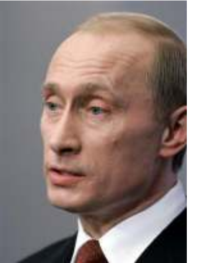
ရုရှားသမ္မတ ဗလာဒီမီာပူတင်

လက်မခံကြောင်း ရှင်းရှင်းလင်းလင်းပြောကြားခဲ့သော်လည်း ဘုရှ်နှင့် ပွင့်လင်းလင်း ဆွေးနွေးရသည်မှာ အကျိုးရှိကြောင်း ပြောကြားခဲ့သည်။ အနောက်တိုင်းနှင့် ရုရှားပြည်သူ့အခွင့်အရေးလှုပ်ရှားသူများက ပူတင်သည် ပြည်နယ်အုပ်ချုပ်ရေးမှူး ရွေးကောက်ပွဲများကို ဖျက်သိမ်းပစ်လိုက်ခြင်း၊ ယူကရိန်းကုမ္ပဏီအားအငြိုးဖြင့် နှိပ်စက်နေခြင်းနှင့် ကရင်မလင်မှ မီဒီယာများအပေါ်တင်းကျပ်စွာ ချုပ်ကိုင်နေခြင်း စသည်အားဖြင့် ဒီမိုကရေစီကို ချုပ်ချယ်နေကြောင်း၊ စွပ်စွဲပြောဆိုလိုက်သည်။ ထို့ပြင် ယူကရိန်း၏ လွတ်လပ်စွာရွေးကောက်ပွဲကိုလက်ခံရန် ရုရှအနေဖြင့် ဆန္ဒမရှိကြောင်း နောက်ဆုံးနုမူနာကိုထောက်ပြပြီး ပူတင်သည် ဆိုဗီယက်အုပ်စုဝင်ဟောင်းနိုင်ငံများ၏ ဒီမိုကရေစီ အပြောင်းအလဲများအား ထိန်းချုပ်ရန် ကြိုးပမ်းနေမှုကို ၎င်းတို့အနေဖြင့် စိုးရိမ်နေကြသည်။ ထို့ပြင်ချင်ညာ (Chechnya)ခွဲထွက်ရေးသမားများအပေါ် ချေမှုန်းနေခြင်းနှင့် တောင်ပိုင်းပြည်နယ်ရှိ အရပ်သားများအား ညှဉ်းပန်းနှိပ်စက်ခြင်းနှင့် သတ်ဖြတ်နေခြင်း