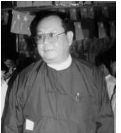
ရှမ်းတိုင်းရင်းသားခေါင်းဆောင် ဦးခွန်ထွန်းဦး

ခပ်ရှမ်းရှမ်းပြောရရင် ဒီညီလာခံက ထွက်လာမယ့် ဖွဲ့စည်းပုံအခြေခံဥပဒေရဲ့ တရားဝင်မှုကို ကြည့်ရမယ်လေ။ ဘာလို့လဲဆိုတော့ ကျနော်တို့ (၇၂%) ရတဲ့ အဲဒီအယ်လ်ဒီလည်းမပါဘူး။ ကျနော်တို့ (၆၇) နေရာရတဲ့ တိုင်းရင်းသားပါတီတွေလည်း မပါဘူး။ အဲဒီပါတီတွေမပါဘဲနဲ့ဆိုတော့ လုပ်တဲ့ ညီလာခံကနေထွက်လာတဲ့ ဖွဲ့စည်းပုံအခြေခံဥပဒေကို ကမ္ဘာကလက်ခံမလား (သို့မဟုတ်) တိုင်းသူပြည်သားများက လက်ခံမလား။ နောက်ပြီးတော့ တိုင်းရင်းသားတွေအားလုံးအတွက် အာမခံချက်ရှိမလား။ လုံခြုံမှုအတွက် ဘယ်လောက်ရှိမလဲဆိုတာကျနော်တို့ အများကြီး တွက်ရဦးမှာပါ။