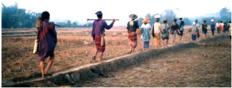
ကာလမ်းဖောက်လုပ်ရာတွင် အဓမ္မလုပ်အားပေးခိုင်းစေခြင်းခံရသော ကရင်ပြည်နယ်လှိုင်းဘွဲ့မြို့နယ် ကွပ်ဘီရွာမှရွာသားများ

အိုင်အယ်လ်အိုကိုယ်စားလှယ်အဖွဲ့၏ အလုပ်သမား အလုပ်သမားစံချိန်စံညွှန်းရေးရာ အမှုဆောင်ညွှန်ကြားရေးမှူးက “အိုင်အယ်လ်အိုအနေနဲ့ ရာထူးမှဖယ်ရှားခံရသူ ဝန်ကြီးချုပ်ဟောင်းနှင့် အလုပ်သမားဝန်ကြီးတို့နှင့် အရင်ကလုပ်ကိုင်နေခဲ့တာပါ။ မြန်မာစစ်အုပ်စုအနေဖြင့် အိုင်အယ်လ်အိုနှင့် ဆက်လက်ပူးပေါင်းဆောင်ရွက်လိုစိတ်ရှိမရှိ သဘောထားကို အိုင်အယ်လ်အိုအုပ်ချုပ်ရေး