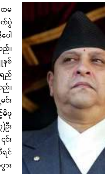
နီပေါ ဘုရင်ဂျန်နှင့်ဒဂုန်

အဖြစ် ရှုထောင့်ပြောဆိုလိုက်သည်။ နီပေါနိုင်ငံသည် ၁၉၉၁ ခုနှစ်၌ ပထမဆုံးအကြိမ် ပါတီဒီမိုကရေစီရွေးကောက်ပွဲ ကျင်းပခဲ့ရာ ဝိသိဟာရာဘုရင် နီပေါနိုင်ငံ၏ ပထမဆုံးဝန်ကြီးချုပ်ဖြစ်လာခဲ့သည်။ ၁၉၉၆ ခုနှစ်တွင် မော်ဝါဒီ နီပေါကွန်မြူနစ်ပါတီက ဘုရင်စနစ်အားဖယ်ရှားရန်ရည်ရွယ်၍ လက်နက်ကိုင်ပုန်ကန်မှု စတင်ခဲ့သည်။ ၂၀၀၁ ခုနှစ် ဇွန်လ(၁)ရက်က အိမ်ရှေ့မင်းသား ဒီပင်ဒရာက ဘုရင်ဘိရင်ဒရာနှင့်မိဖုရား အစ်ရှ်ဝါရုနှင့် အခြားမိသားစုဝင် (၇)ဦး တို့အား လုပ်ကြံသတ်ဖြတ်ပစ်လိုက်ပြီး ၎င်းကိုယ်တိုင်လည်း ကိုယ့်ကိုယ်ကိုအဆုံးစီရင်သည် နန်းတွင်းအရေးအခင်းကြီး ဖြစ်ပွားခဲ့သည်။ ထိုအချိန်မှစ၍ ပြည်သူများက ဘုရင်စနစ်အပေါ်ယုံကြည်မှု လျော့ပါးလာကြသည်။