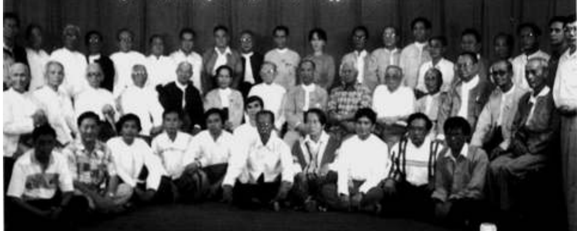
စီအာရ်ပီအဖွဲ့ဝင်များနှင့် တိုင်းရင်းသားလူမျိုးစုံမှ ကိုယ်စားလှယ်များအတူ တွေ့မြင်ရစဉ်

၁၉၉၀ ပြည့်နှစ်ရွေးကောက်ပွဲကို နဝတ၊ နအဖများက ၃-၅-၈၉ နေ့စွဲဖြင့် ထုတ်ပြန်ခဲ့သည့် ပြည်သူ့လွှတ်တော်ရွေးကောက်ပွဲ ဥပဒေအမှတ် ၁၄/၈၉ အရ ကျင်းပခဲ့ခြင်းဖြစ်သည်။ (၁) ယင်းဥပဒေ၏ နိဒါန်းတွင် လွတ်