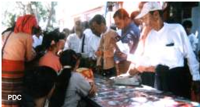
(၅၈) ကြိမ်မြောက် ပြည်ထောင်စုနေ့ အခမ်းအနားကို တက်ရောက်လာသူအချို့

ပေးနိုင်မည့် ပြည်ထောင်စုစစ်စစ်ပေါ်တွင် အခြေခံသည့်ဖွဲ့စည်းပုံ အခြေခံဥပဒေတရပ် လိုအပ်မှုကို ထောက်ပြထားသည်။ ထို့အပြင် ကျင်းပတော့မည့် နအဖ အမျိုးသားညီလာခံ နှင့်စပ်လျဉ်း၍လည်း “နအဖမှ ကြီးမားကျင်းပ