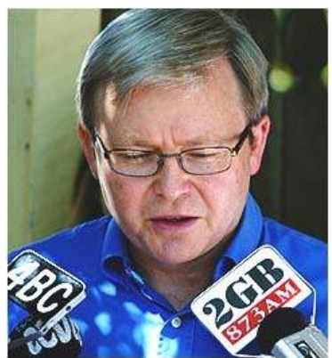
အတိုက်အခံလေဘာပါတီ နိုင်ငံခြားရေး ဌာန ပြောခွင့်ရသူ Kevin Rudd

ဩစတေးလျနိုင်ငံအပါအဝင် ဒေသတွင်း ဒီမိုကရေစီအစိုးရများအနေဖြင့် အာဏာကို ချုပ်ကိုင်ထားသောအကျင့်အပြစ်အစကို မလိုလားကြောင်းဆက်လက်ပြသသင့်ပြီး၊ စစ်အရာရှိများကို အထိနာစေမည့် အရေးယူမှု နည်းလမ်းများကို ရှာဖွေသင့်ကြောင်း ဩစတေးလျအတိုက်အခံလေဘာပါတီ နိုင်ငံခြားရေးဌာနပြောခွင့်ရသူ Kevin Rudd က ဖေဖော်ဝါရီ (၁၄) ရက်နေ့တွင် ဩစတေးလျ လွှတ်တော်၌ ပြောဆိုလိုက်သည်။