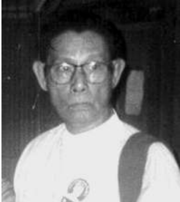
အမျိုးသားဒီမိုကရေစီအဖွဲ့ချုပ် ၃-ဥက္ကဋ္ဌ ဦးတင်ဦး အာဏာပိုင်များက ဖယ်ရှားခဲ့သည်။ ❖

အသက်(၇၀)နှစ်ရှိပြီဖြစ်သော ဦးတင် ဦးကို စစ်အုပ်စုက ယမန်နှစ် ဖေဖော်ဝါရီ (၁၃)ရက်နေ့မတိုင်ခင်အထိ ( ၁၀-က)ဖြင့် ကလေးအကျဉ်းထောင်တွင် ( ၈)လကြာ ချုပ်နှောင်ထားခဲ့သည်။ ထို့နောက် နေအိမ် အကျယ်ချုပ်ဖြင့် တနှစ်ကြာ ဆက်လက်ဖမ်း ဆီးထားပြီး၊ ပါတီဝင်များနှင့် တွေ့ဆုံခွင့်မပြုခဲ့ ပေ။ အဲဒီအယ်လ်ဒီ အထွေထွေအတွင်းရေး မှူး ဒေါ်အောင်ဆန်းစုကြည်ကိုလည်း ပြီးခဲ့ သည့် နိုဝင်ဘာလကတည်းက အာဏာပိုင်များ က နေအိမ်အကျယ်ချုပ်သက်တမ်း တနှစ်တိုး ခဲ့ပြီး၊ ဒီဇင်ဘာလလယ်ခန့်တွင် လုံခြုံရေးတာ ဝန်ထူထားသော အဲဒီအယ်လ်ဒီလူငယ်များကို