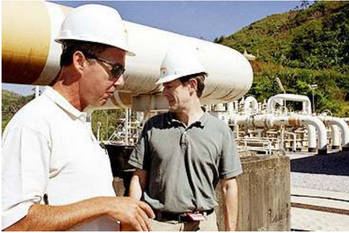
ထိုင်းမြန်မာနယ်စပ် နတ်အိမ်တောင်ဒေသမှ TOTAL ကုမ္ပဏီပိုင် ဓာတ်ငွေ့ပိုင်းလောင်း

ဗမာပြည်ရေးရာလုပ်ငန်းအဖွဲ့ (ဗြိတိန်) က ရက်စက်ကြမ်းကြုတ်သည့် ဗမာပြည် စစ်အာဏာရှင်အစိုးရအား ငွေကြေးထောက်ပံ့နေခြင်းများနှင့် အကာအကွယ်ပေးနေခြင်းများတွင်တိုတယ် (TOTAL) ရေနိုကုမ္ပဏီကြီးသည် အဓိကအခန်းမှ မည်သို့မည်ပုံပါဝင်နေသည်ကို ထုတ်ဖော်လိုက်သည့် အစီရင်ခံစာတစ်စောင်ကို ဖေဖော်ဝါရီလ (၂၁) ရက်နေ့က ထုတ်ပြန်လိုက်သည်။