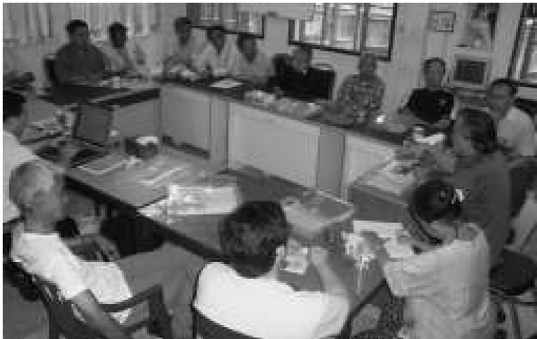
၁၉၉၀ ရွေးကောက်ပွဲ အရွေးကောက်ခံ လွှတ်တော်ကိုယ်စားလှယ်များအဖွဲ့ (MPU) အစည်းအဝေးပြုလုပ်နေစဉ်