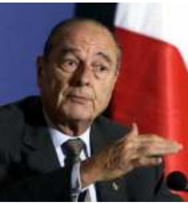
ပြင်သစ်သမ္မတ ဂျက်ရှီရတ်