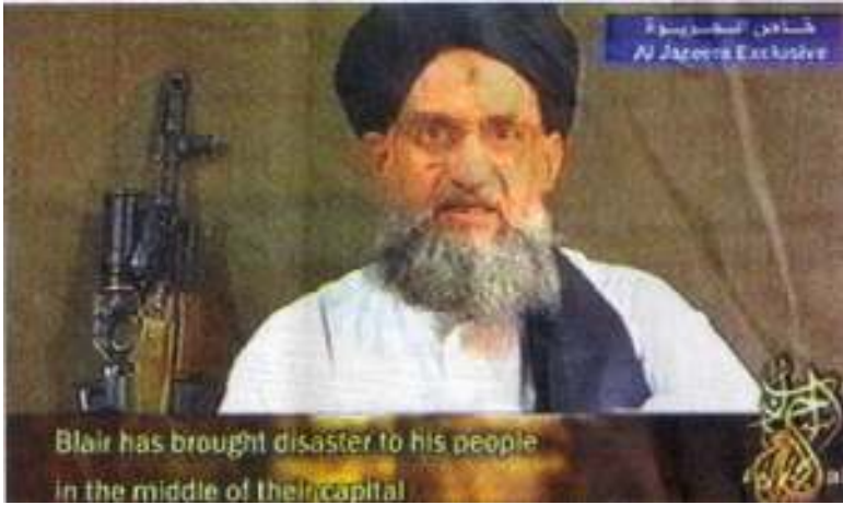
အယ်ကိုင်ဒါ အကြမ်းဖက်အဖွဲ့၏ နံပါတ် (၂) ခေါင်းဆောင် အိုက်မန်အယ်ဇာဝါမီရီ ဗီဒီယိုတိုက်ခွဲတွင် တွေ့ရပုံ

စက်တင်ဘာ (၆) ရက်နေ့ ၊ ၂၀၀၅။ အယ်ကိုင်ဒါ အကြမ်းဖက်အဖွဲ့၏ နံပါတ် (၂) ခေါင်းဆောင် အိုက်မန်အယ်ဇာဝါမီရီက၊ ဗြိတိသျှဝန်ကြီးချုပ်တိုနီဘလ်အား၊ ဗီဒီယိုခွဲဖြင့်ပေးပို့ထုတ်ပြန်သော ထုတ်ပြန်ကြေညာချက်တစ်ခုတွင် အပြင်းအထန်ပုတ်ခတ်ဝေဖန်ထားကြောင်း စက်တင်ဘာ(၃) ရက်နေ့ထုတ်သတင်းစာများတွင် ဖော်ပြထားသည်။ ဝန်ကြီးချုပ်က လန်ဒန်ပို့ဆွဲမှု