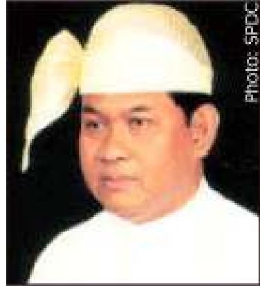
ဦးသန်းအောင်

ပြီး နာမအတ္ထုစီရင်ရေး (SPDC) အဖွဲ့ဝင်တစ်ဦးလည်းဖြစ်သော ဒုတိယဗိုလ်ချုပ်ကြီး ရဲမြင့်အား စစ်ဖက်သို့ပြန်လည် ရွှေ့ပြောင်းခဲ့ကြောင်းစစ်တပ်နှင့် နီးစပ်သော သတင်းရပ်ကွက်များမှ အေအက်မ်ပီသို့ ပြောကြားခဲ့သည်။ ဒုတိယဗိုလ်ချုပ်ကြီး ရဲမြင့်နေရာတွင် စစ်ရေးလေ့ကျင့်ရေးမှူးချုပ် ဒုတိယဗိုလ်ချုပ်ကြီး ကျော်ဝင်းအား အစားထိုးခဲ့သည်။ (SPDC) အဖွဲ့ဝင်တစ်ဦးအား စစ်ဖက်သို့ ပြန်ပို့ခြင်းမှာ ယခုအကြိမ်သည် ပထမဦးဆုံးအကြိမ်ဖြစ်၍ ထူးခြားပြီးမကြုံစဖူး ရာထူးအချိန်အပြောင်းဖြစ်ကြောင်း၊ နောင်လာမည့် အရေးပါသော စစ်ဖက်ဆိုင်ရာ အထူးခန့်အပ်မှုများအား အကျိုးသက်ရောက်လာနိုင်ကြောင်း၊ ပုံမှန်အားဖြင့် ဗိုလ်ချုပ်ကြီးများသည် အထူးဗျူဟာမှူးချုပ်များဖြင့် အနားယူသွားလေ့ရှိကြောင်း လေ့လာသုံးသပ်သူတစ်ဦးကဆိုသည်။ အောက်တိုဘာလတွင် ဗိုလ်ချုပ်ခင်ညွှန်အားဖြုတ်ချပြီးနောက် တပ်တွင်း၌ သန့်စင်မှုအများအပြားပြုလုပ်ခဲ့ပြီး မေလ (၂၉) ရက်နေ့တွင် ၎င်းတို့၏ သစ္စာရှိအမာခံများအား ရာထူးတိုးမြှင့်ခန့်ထားခဲ့သည်။ ကချင်ပြည်