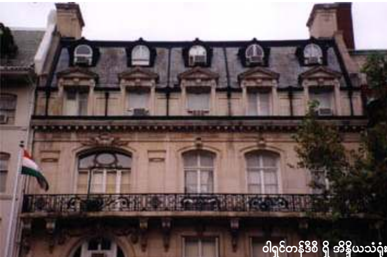
ဝါရှင်တန်ဒီမို ကြီးအိန္ဒိယသံရုံး

ဩဂုတ်(၂၉)၊ ၂၀၀၅ အမေရိကန်နိုင်ငံ ဝါရှင်တန်အခြေစိုက် မြန်မာ့ဒီမိုကရေစီအင်အားစုများသည် ဒေါ်အောင်ဆန်းစုကြည်နှင့် မြန်မာပြည်လွတ်မြောက်ရေးအတွက် နယူးယောက်မြို့ရှိ ကုလသမဂ္ဂရုံးချုပ်သို့ ဦးတည်ပြီး ဆက်လက် ခရီးရှည်ချီတက်နေရာ ယနေ့ဆိုလျှင် မိုင်ပေါင်း (၁၇၀) ကျော် ခရီးပေါက်ခဲ့ပြီး နယူးဂျာစီပြည်နယ်၊ ဘာလင်တန်မြို့သို့ရောက်ရှိနေပြီ ဖြစ်ကြောင်းသိရှိရသည်။ ထိုဒေသရှိ လူ့အခွင့်အရေးအသင်း၊ ဘာသာရေးအသင်းနှင့် အခြားငြိမ်းချမ်းရေးအသင်းများက ထိုလမ်းလျှောက်ချီတက်ပွဲကို အထူးစိတ်ဝင်စားကြပြီး ထိုခရီးစဉ်၏ ရည်ရွယ်ချက်နှင့် ယနေ့အထိ အကျယ်ချုပ်မှ မလွတ်မြောက်သေးသော ဒေါ်အောင်ဆန်းစုကြည်၏ ကိုယ်ကျိုးစွန့်အနစ်နာခံသောကြောင့်နှင့် ပြည်သူ့အ