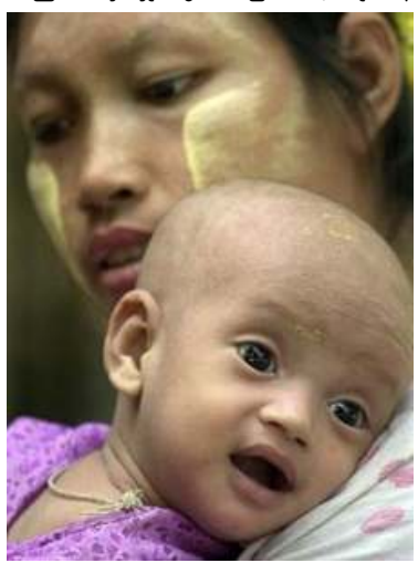
အေအိုင်ဒီအက်စ်ရောဂါ ခံစားနေရသော မြန်မာကလေးငယ်တဦး

ဘိန်းအစားထိုးသီးနှံစီမံကိန်း၊ မကွေးတိုင်းနှင့်ချင်းတောင်တန်းအကြားရှိ ဆင်းရဲမှုတိုက်ဖျက်ရေးစီမံကိန်း၊ ရခိုင်ပြည်နယ် မောင်တောဒေသမှ ဒုက္ခသည်ကယ်ဆယ်ရေးစီမံကိန်းနှင့် ဧရာဝတီတိုင်း၊ လပွတ္တာဒေသမှ ဆူနာမီရေလှိုင်းဒဏ်ခံရသူများ ကယ်ဆယ်ရေးစီမံကိန်းများဖြစ်ပြီး လူဦးရေ (၇) သိန်းခွဲခန့်ကို ၎င်းတို့အဖွဲ့မှ အကူအညီပေးနေကြောင်း မစ္စတာမောရစ်က ပြောကြားခဲ့သည်။ မစ္စတာမောရစ်၏ (၄) ရက်ကြာခရီးစဉ်တွင် နိုင်ငံရေးကိစ္စများကိုပါ ဆွေးနွေးမည်ဟု အများက မျှော်လင့်သော်လည်း (WFP Project) တခုတည်းကိုသာ ဆွေးနွေးသွားခဲ့သည်။ (Altsean Burma) ကိုယ်စားလှယ် ဝက်ဘီစတီဟက်က (WFP) မှ ပြဿနာကို အမှန် တကယ်ဖြေရှင်းလိုစိတ်ရှိသည်ဆိုပါက ယခုလို သတင်းစာရှင်းလင်းပွဲ ခေါ်ယူနေရုံဖြင့် မလုံလောက်ပဲ ကုလသမဂ္ဂ လုံခြုံရေးကောင်စီသို့ တိုင်ကြားသင့်ကြောင်း သူမကဆိုသည်။ (WFP) သည် ၁၉၉၄ တွင် မြန်မာနိုင်ငံအတွင်း ဘင်္ဂလားဒေ့ရှ်နိုင်ငံမှ ပြန်လည်ဝင်ရောက်လာသူများကို အကူအညီပေးခြင်းဖြင့်စတင်ခဲ့ပြီး ၁၉၉၆ တွင် ကယ်ဆယ်ရေးလုပ်ငန်းများအပြင် (HIV/AIDS) ရောဂါရှင်များ သက်ကြီးရွယ်အိုဆင်းရဲသားများနှင့် မူလတန်းဆင့် ပညာသင်ကြားနေသည့် ကလေးငယ်များ ထောက်ပံ့ကူညီသည့် လုပ်ငန်းများကို တိုးချဲ့လုပ်ကိုင်ခဲ့သည်။ ❖