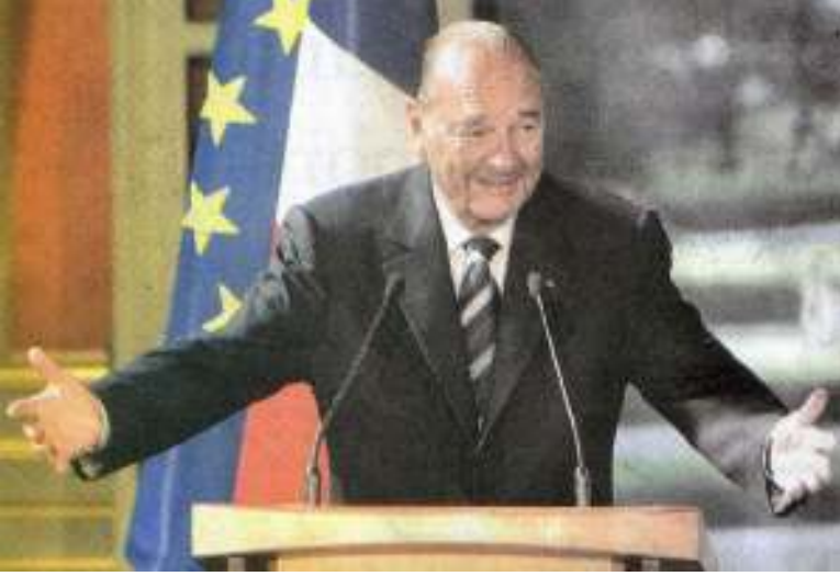
ပြင်သစ်သမ္မတကြီး ( Jacques Chirac )

ပြင်သစ်သမ္မတကြီး ( Jacques Chirac ) က အီရန်အပေါ် ဖိအားပေးမှုကို ဩဂုတ်လ (၂၉) ရက်နေ့က မြှင့်တင်လိုက်ပြီး၊ အထိမခံ ရွှေ့ပုံပြစ်နေသည့် ချူးကလီးယားလက်နက်များကို ရပ်ဆိုင်းခဲ့သည့် အပြန်အလှန်အား ဖြင့်ပေးကမ်းမည့် ဥပဒေပညာရှင် မက်လိုးများ ကမ်းလှမ်းချက်များကို စဉ်းစားရန် သတိပေးလိုက်သည်။ အကယ်၍ အီရန်က ဥပဒေပညာရှင် ပူးပေါင်းဆောင်ရွက်မှုမရှိခဲ့လျှင် သံသယဖြစ်နေသည့် ချူးကလီးယားလက်နက်များ ထုတ်လုပ်မှုကို ကုလသမဂ္ဂလုံခြုံရေးကောင်စီမှ စစ်ဆေးရန်မရှိမည်ဟု ထုတ်ဖော်ပြောဆိုခဲ့သည်။ ဩဂုတ်လ စောစောပိုင်းတွင် အီရန် အာဏာပိုင်တို့က အီရန်ကမ်းလှမ်းချက်ကို ပယ်ချခဲ့ပြီး၊ ချူးကလီးယားလက်နက်များကို ပြန်လည် စတင်လုပ်ဆောင်ခဲ့သည်။ သို့အတွက်ကြောင့် သုံးပွင့်ဆိုင် ထိုင်ကာအဖွဲ့ဝင်