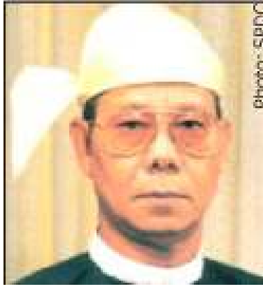
ဦးသန်းရွှေ