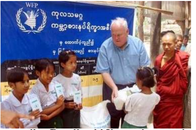
ကမ္ဘာ့စားနပ်ရိက္ခာအစီအစဉ် အကြီးအကဲ ဂျိမ်းမောရစ်နှင့် မြန်မာကလေးငယ်များအား တွေ့ရစဉ်

မောရစ်က ပြောသည်။ (WFP) မှ အေအိုင်ဒီအက်စ်ရောဂါခံစားနေရသော မိသားစုများအား ဝေငှသည့် ပြည်တွင်းမှဆန်ကို နိုင်ငံခြားငွေဖြင့်ဝယ်ယူရပြီး စစ်အစိုးရက ထိုဆန်အတွက် ပို့ကုန်ခွန် ၁၀ ရာခိုင်နှုန်းကောက်ခံသည်။ ဝန်ကြီးချုပ် ဗိုလ်ချုပ်ကြီးစိုးဝင်းနှင့် တနာရီကျော်ကြာတွေ့ဆုံစဉ် မစ္စတာမောရစ်က မြန်မာပြည်တွင် ငတ်မွတ်ခေါင်းပါးမှုအခြေအနေသည် စိုးရိမ်ဖွယ်ရာကောင်းပြီး လက်သင့်ခံနိုင်ဖွယ်မရှိကြောင်းနှင့် ယင်းပြဿနာကို မဖြေရှင်းပါက တန်ဖိုးကြီးကြီးပေးရလိမ့်မည်ဟု မြန်မာစစ်ခေါင်းဆောင်များ သဘောပေါက်အောင်ကြိုးပမ်းခဲ့ပြီး ယခုကဲ့သို့ ဆိုးဆိုးဝါးဝါးအခြေအနေများ ပိုမိုကောင်းမွန်လာရန်မှာ စစ်အစိုးရအပေါ်တွင်သာမူတည်ကြောင်းပြောခဲ့သည်ဟု ဆိုသည်။ (WFP) ၏ စီမံကိန်းများရှိသည့် ဒေသများမှာ “ဝ” နယ်