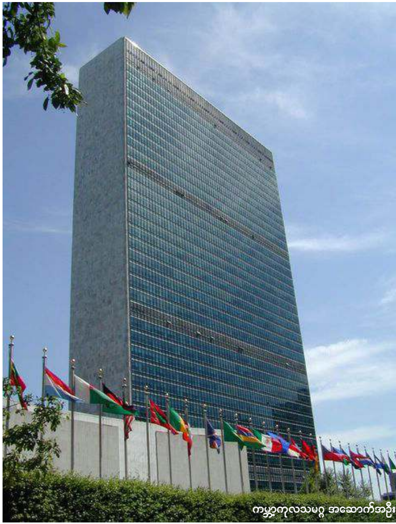
ကမ္ဘာ့ကုလသမဂ္ဂ အဆောက်အအုံ

ရိုနီဗာအခြေစိုက်၊ ကမ္ဘာလုံးဆိုင်ရာ အေအိုင်ဒီအက်စ်၊ တီဘီနှင့် ငှက်ဖျားတိုက် ဖျက်ရေးအဖွဲ့ (Global Fund to Fight AIDS, Tuberculosis and Malaria-GFATM) အဖွဲ့မှ ၎င်း၏ လူမှုဝန်ထမ်းအရာရှိများအပေါ် နအဖစစ်အစိုးရ၏ ချုပ်ချယ်ကန့်သတ်မှု များကြောင့်တီဘီ၊ အေအိုင်ဒီအက်စ်၊ ငှက်ဖျားရောဂါများတိုက်ဖျက်ရေးအတွက် ပေးအပ်ထားသော ဖန်ငွေများကိုဒီဇင်ဘာလ (၁) ရက်နေ့မှစ၍ ရပ်ဆိုင်းတော့မည်ဖြစ်ကြောင်း ဩဂုတ် (၁၀) က ကြေညာလိုက်သည်။ အဖွဲ့၏ ပြောရေးဆိုခွင့်ရှိသူ John-Liden က “ကျနော်တို့ အခုလိုရပ်ဆိုင်းရတာ အင်မတန်ဝမ်းနည်းစရာပါ။ ကျနော်တို့အလုပ်လုပ်ဖို့ ဘယ်လိုမဖြစ်နိုင်လို့ ဒီအကူအညီတွေ ရပ်ဆိုင်းခဲ့တာပါ” ဟု ပြောသည်။ လီဒင်က အစိုးရသည် ရောဂါရှင်များအတွက် အရေးကြီးသော ဆေးဝါးသယ်ယူပို့ဆောင်ရေးများကိုပင် တင်းတင်းကျပ်ကျပ်ချုပ်ချယ်ကန့်သတ်မှုများကြောင့် သူတို့၏လုပ်ငန်းများကို အကောင်အထည်မဖော်နိုင်ဖြစ်ရသည်ဟု ဆိုသည်။ “ဒီလိုဆိုပြတ်ရတာ လွယ်ကူတဲ့ ဆုံးဖြတ်ချက်တခုတော့ မဟုတ်ပါဘူး။ ဒါပေမယ့် တခြားနည်းလမ်းရှိပါဘူး။ ဒီမှာ ကျနော်တို့ တခန်းရပ်တာပါ။ လူတွေအတွက် အကျိုးရှိတဲ့နေရာတွေမှာ ငွေတွေကိုသုံးစွဲသလားဆိုတာ ကျနော်တို့ အာမခံချက်မပေးနိုင်တော့ပါဘူး” ဟု သူကဆိုသည်။ နအဖသည် ၎င်းတို့လေးစားလိုက်နာမည်ဟု စာဖြင့်ရေးသားထားခဲ့သော အာမခံချက်များကိုဖောက်ဖျက်ခဲ့ခြင်း၊ လူသားချင်း အကူအညီပေးရေးလုပ်ငန်းများ ဆောင်ရွက်နေကြသော ဝန်ထမ်းများ၏ သွားလာလှုပ်ရှားမှုများကို ကန့်သတ်ခြင်း၊ ဆေးဝါးတင်သွင်းမှုအပေါ်ကန့်သတ်ခြင်း စသည်တို့ကို တိုးတက်ပြုလုပ်လာသောကြောင့် ဂလိုဘယ်ဖန်တီးမှုမှ ၎င်း၏အကူအညီများကို ရပ်ဆိုင်း