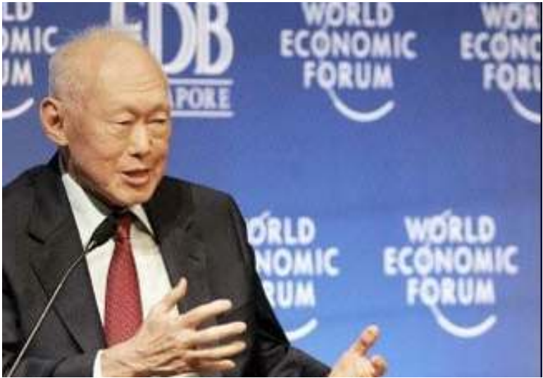
စင်ကာပူဝန်ကြီးချုပ်ဟောင်း လီကွမ်ယု

နာမစစ်အုပ်စု၏အစဉ်အဆက်အဖြစ်အပျက်များမှာပဲ ရပ်တန့်ပြီး မနေနိုင်ဘဲကမ္ဘာကြီးဟာ ပြောင်းလဲနေတယ်။ ရှေးသို့တိုးတက်နေတယ်ဆိုတဲ့ အချက်ကိုရင်ဆိုင်ရမှာဖြစ်သည်ဟု စင်ကာပူဝန်ကြီးချုပ်ဟောင်းလီကွမ်ယုက ပြောဆိုသည်။ ဂျပန်နိုင်ငံထုတ် ယိုမီယူရီရှင်းဘွန်းသတင်းစာနှင့် အင်တာဗျူးတွင်စစ်တပ်အုပ်ချုပ်သည့် မြန်မာပြည်၏ပြဿနာသည် ပို၍ကျယ်ဝန်းသောဒေသတွင်းသို့ ကူးစက်လာတော့မည်ဖြစ်ကြောင်း သတိပေးလိုက်သည်။ အချိန်တစ်ခုမှာရပ်တန့်နေတာ ဟာသူတို့ပြဿနာကို သူတို့တည်ဆောက်နေခြင်းဖြစ်ပြီး ထိုပြဿနာများသည် အာဆီယံအဖွဲ့တွင်းသို့ရောက်ရှိလာမည်ဟု သူကဆိုသည်။ ပြီးခဲ့သည့်လက ဗီယက်ကျွန်းတွင်းပင်သော အာဆီယံဝန်ကြီးများအစည်းအဝေးတွင် နာမစစ်အုပ်စုအဖွဲ့အစည်းကို ဥက္ကဋ္ဌရာထူးကို ပြည်တွင်းနိုင်ငံရေးအခြေအနေများကို အာရုံစိုက်လိုသည်ဟုသော အကြောင်းပြချက်ဖြင့် စွန့်လွှတ်ခဲ့သည်။ ထိုကိစ္စကို မစ္စတာလီကွမ်ယုအားမေးမြန်းရာ သူကနာမစစ်အုပ်စုအဖွဲ့အစည်း အခြေအနေတစ်ခုမှအစပြုနိုင်ခဲ့သော်လည်း ပြဿနာကတော့ရှိနေဆဲပင်ဖြစ်ကြောင်း မှတ်ချက်ချခဲ့သည်။ ချမ်းသာသော အိမ်နီးချင်းထိုင်းနိုင်ငံနှင့် နှိုင်းယှဉ်ကြည့်လျှင် မြန်မာပြည်၏ဆင်းရဲမွဲတေမှုသည် ပြည်သူလူထုကြား စိတ်ပျက်မှုကိုဖြစ်စေသည်ဟု ယုံကြည်ကြောင်း သူကပြောခဲ့သည်။ ❖