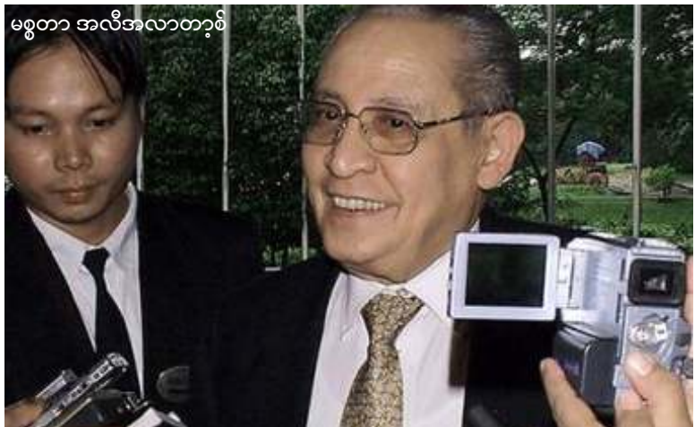
မစ္စတာ အလီအလာတောင်

ကုလသမဂ္ဂအတွင်းရေးမှူးချုပ် အထူးကိုယ်စားလှယ် မစ္စတာအလီအလာတောင်သည် ဩဂုတ်လ (၁၇) ရက်နေ့က ရန်ကုန်မြို့သို့ ရောက်ရှိခဲ့ပြီး စက်တင်ဘာလတွင် နယူးယောက်မြို့ကျင်းပမည့် ကုလသမဂ္ဂညီလာခံတွင် ကုလသမဂ္ဂဖွဲ့စည်းပုံပြင်ပြောင်းလဲရေးအပေါ် မြန်မာနိုင်ငံ၏ဘာသာကို ဗိုလ်ချုပ်မှူးကြီးသန်းရွှေနှင့် ဆွေးနွေးခဲ့ကြသည်။ တနင်္ဂနွေနေ့က မြန်မာနိုင်ငံသို့ ထိုဆွေးနွေးပွဲတွင် ကုလသမဂ္ဂပြုပြင်ပြောင်းလဲရေးကိစ္စများကိုဆွေးနွေးခဲ့ပြီး ဒေါ်အောင်ဆန်းစုကြည်လွတ်မြောက်ရေးနှင့် မြန်မာ့ဒီမိုကရေစီရေးတို့ကို ဆွေးနွေးခဲ့ခြင်းမရှိပေ။ မစ္စတာအလာတောင်က “ကျနော် ဒီတိုက်ရိုက်ရန်ကုန်လာတာဟာ ကုလသမဂ္ဂအထူးကိုယ်စားလှယ်အနေနဲ့ ကုလသမဂ္ဂပြုပြင်ပြောင်းလဲရေးကိစ္စ ဆွေးနွေးဖို့သာဖြစ်ပါတယ်။ ကုလသမဂ္ဂကနေ တခြားတဦးကို တာဝန်ပေးထားတဲ့ မြန်မာနိုင်ငံရေးအဆင်ပြေအောင် ကြားဝင်ညှိနှိုင်းရေးကိစ္စအတွက် မဟုတ်ပါဘူး”ဟု ပြောသည်။ သုံးရက်ကြာခရီးစဉ်တွင် အမျိုးသားညီလာခံကော်မရှင်၊ နာမအလင်အောက်ခံ အမျိုးသမီးရေးရာ၊ ကြို့ဖွဲ့အသင်းတို့နှင့် တွေ့ဆုံခဲ့သော်လည်း အမျိုးသားဒီမိုကရေစီအဖွဲ့ချုပ်နှင့် အခြားတိုင်းရင်းသားအဖွဲ့များအား တွေ့ဆုံခဲ့ခြင်းမရှိပေ။ ထိုကဲ့သို့ တွေ့ဆုံမှုမရှိခြင်းနှင့်ပတ်သက်၍ အင်အားစုအဖွဲ့ဝင်များက ပုဂ္ဂိုလ် ဦးလွင်က “(UNDP/UNICEF/WHO) အေဂျင်စီတွေရဲ့ အသုံးစရိတ်ပေါ့။ အဲဒါတို့ရဲ့ (Fund) ရရှိဖို့ အဲဒါတွေနဲ့ပတ်သက်လို့ သူတို့ပုံစံအသစ်ချတယ်။ အဲဒါကိုလာပြီး ရှင်းဖို့ဟာက သူတို့ရဲ့အကြီးအကျယ်လုပ်ငန်းပဲ။ နိုင်ငံရေးကိစ္စက ရှိချင်ရှိမယ်။ (Trip) မှာတော့မပါဘူး။ (Trip) မှာပါတာက အချိန်ကဘက်မလိုက်နိုင်အစဉ်အဝေးမှာ ကိုမိအာ