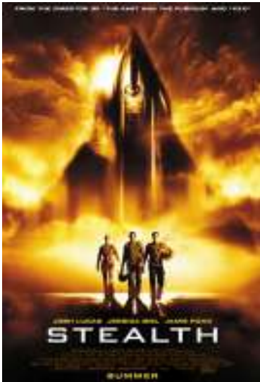
Stealth - 2005 ဇာတ်ကား မျက်နှာပုံး