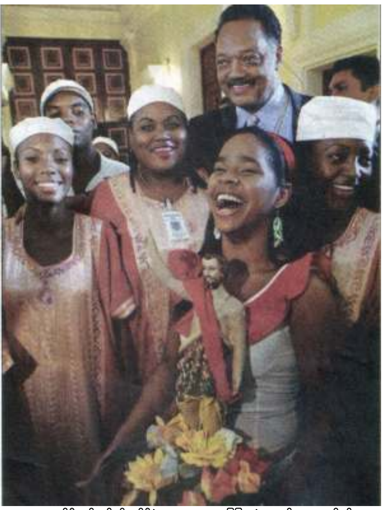
မစ္စတာ ဂျက်စီဂျက်ဆန်နှင့် ပင်နီစွဲလား လူထုအခြေပြုအဖွဲ့အစည်းများမှ ပုဂ္ဂိုလ်များ Jackson) က ရောဘတ်ဆင်၏ မှတ်ချက်ချပြောဆိုမှုသည် မနှစ်မြို့ဖွယ်ရာဖြစ်ပြီး ကျင့်ဝတ်သိက္ခာနှင့်လည်း မညီညွတ်သည့်အပြင် တရားဝင်မှုလည်းမရှိဟု မစ္စတာဟူဂိုဂျေဗတ်ဇ်က ထောက်ခံပြောကြားခဲ့သည်။ မစ္စတာ ( Jess Jackson) က သမ္မတဟူဂိုအား မစ္စတာဂျက်ဆင်၏ ထုတ်ဖော်ပြောဆိုမှုအပေါ် အလျင်အမြန်ကန့်ကွက်သည့် ထုတ်ပြန်ကြေညာချက်တစောင် ထုတ်ပြန်ရန် တိုက်တွန်းလိုက်သည်။ ❖

ပင်နီစွဲလား သမ္မတ ဟူဂိုဂျေဗတ်ဇ်က ခရစ်ယာန်တရားဟောဆရာ ပက်ရီဘတ်ဆင်အား တရားဥပဒေအရ အရေးယူရန်နှင့် သူ၏မူရင်းနိုင်ငံသို့ ပြန်ပို့ရန် ဖြစ်ပွယ်ရှိသည့်အလားအလာများကို ရှာဖွေနေသည်ဟု ထုတ်ဖော်ပြောဆိုခဲ့သည်။ ပက်ရီဘတ်ဆင်သည် ဟူဂိုဂျေဗတ်ဇ်အား လုပ်ကြံသတ်ဖြတ်ရန် ဝါဂွင်တန်အားတောင်းဆိုခဲ့သည်။ သမ္မတကြီး ဟူဂိုဂျေဗတ်ဇ်က အကယ်၍ အမေရိကန်အစိုးရက မစ္စတာရောဘတ်ဆင်အားအရေးယူဖို့ပျက်ကွက်ခဲ့လျှင် တရားဥပဒေအရ ရှေးချယ်တင်မြှောက်ထားခြင်းမရှိသည့် သမ္မတဦးကို လုပ်ကြံသတ်ဖြတ်ရန် တောင်းဆိုခဲ့သည့် အကြမ်းဖက်သမားတဦးအား အကာအကွယ်ပေးသည့်အမိဗျယ် သက်ရောက်ကြောင်းပြောကြားလိုက်ပြီး ကုလသမဂ္ဂနှင့် အမေရိကန်နိုင်ငံများအဖွဲ့ (OSA) သို့ သွားရောက်ပြီး အမေရိကန်အစိုးရအား ရှုံ့ချပစ်တင်မည်ဟု ထုတ်ဖော်ပြောကြားခဲ့သည်။ မစ္စတာရောဘတ်ဆင်သည် သမ္မတကြီး ဟူဂိုဂျေဗတ်ဇ်အား အီရတ်သမ္မတ ဆက်ဒမ် ဟူစိန်နှင့် နှိုင်းယှဉ်ပြောဆိုခဲ့ပြီး၊ တနေ့နေ့တွင် ရေနံကြွယ်ဝသည့် ပင်နီစွဲလားနိုင်ငံအား တိုက်ခိုက်ရန်၊ အမေရိကန်အစိုးရအား တိုက်ခိုက်ခွင့်ပေးရန်၊ အမေရိကန်အစိုးရအား တိုက်ခိုက်ခွင့်ပေးရန် ပြောဆိုမှုအပေါ် နောက်ပိုင်းတွင် ဝန်ချတောင်းပန်ခဲ့သည်။ ထိုအတောအတွင်း ပင်နီစွဲလားသို့ အလည်အပတ်ရောက်ရှိနေသူ အမေရိကန် မြို့ပြအခွင့်အရေးခေါင်းဆောင် ( Jess