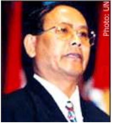
ဗိုလ်မှူးချုပ် ပြည့်စုံ

ဗိုလ်မှူးကြီးသူရိန်ဇော်အား အမျိုးသားစီမံကိန်းနှင့် စီးပွားရေးဖွံ့ဖြိုးမှုဝန်ကြီးဌာန၏ ဒုဝန်ကြီးအဖြစ် စစ်တပ်မှ အသစ်ရွေးချယ်ခန့်အပ်ခဲ့သည်။