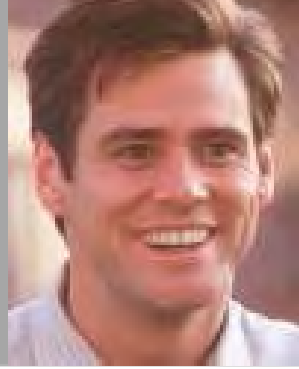
ရုင်မ်ကာရေး (ကမ္ဘာကျော် ဟာသမင်းသား)

“ငြိမ်းချမ်းစွာဆန္ဒပြနေတဲ့သူတွေကို စစ်တပ်ကပစ်ခတ်နေတာ ကမ္ဘာ့ သတင်းမီဒီယာတွေမှာတွေ့နေရတဲ့အတွက် မြန်မာပြည်သူများနဲ့အတူ ခံစားရပါတယ်။ သူတို့တိုင်းပြည်ရဲ့ကြမ္မာဆိုးတွေကြောင့် ကျနော်ကောင်းကောင်း ပွန်မွန်မအိပ်ခဲ့ရဘူး။ ကမ္ဘာ့သူကမ္ဘာသားတွေက သူတို့ကိုစောင့်ကြည့်နေသင့်တယ်။ ဆက်ပြီး သူတို့ဘာတွေဆက်ဖြစ်လာမလဲဆိုတာပေါ့”