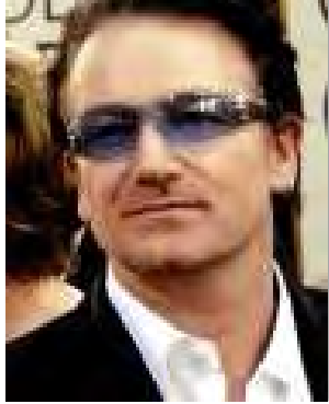
ဘိုနို (ယူတူးအဖွဲ့ ရှေ့ထွက်အဆိုတော်)

“ရဟန်းတော်တွေဟာ ဗုဒ္ဓဟောကြားတော်မူခဲ့တဲ့ မင်းကျင့်တရား ဆယ်ပါးထဲက ‘ပြည်သူကို ရင်ဝယ်သားပမာ ကျင့်ကြံရမယ်’ဆိုတဲ့ မိခင်တ ယောက်က သူ့ရင်သွေးအပေါ်မှာထားတဲ့ ဆုံးစမရှိတဲ့မေတ္တာတရားမျိုးနဲ့၊ မိမိရဲ့ရင်ခွင်တွင်းကသားငယ်ဟာ အမိရင်ကို ခြေဖြင့်ကန်ကျောက်၊ မျက်နှာကို လက်ဝါးဖြင့် ရိုက်ပုတ်စေကာမူ အပြီးမပျက်ချစ်ခင်နိုင်သော မိခင်မေတ္တာမျိုး ဖြင့် ပြည်သူကိုစောင့်ရှောက်ရမယ်ဆိုတဲ့ တရားတော်တွေကို ဟောပြောနေကြ ပါတယ်”