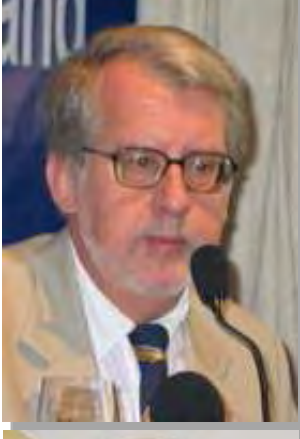
မစ္စတာပင်ဟေးရိုး (မြန်မာပြည်ဆိုင်ရာ ကုလသမဂ္ဂလူ့အခွင့်အရေးကိုယ်စားလှယ်)

“အာဆီယံနိုင်ငံရေးသမားတွေက မြန်မာပြည်မှာ သူတို့ရဲ့ခံစားချက်အစစ်အမှန်တွေကို ငြိမ်းငြိမ်းချမ်းချမ်း ဆန္ဒပြနေမှုတွေအပေါ်မှာ ရက်စက်ကြမ်းတမ်းတဲ့ နည်းလမ်းတွေသုံးပြီး ဖိနှိပ်ဟန့်တားတဲ့အတွက် လူပေါင်းများစွာသေကြေခဲ့ရတာ တွေ့မြင်နေခဲ့ရတယ်”