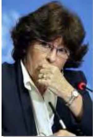
Miss Louise Arbour (ကုလသမဂ္ဂလူ့အခွင့်အရေးကော်မရှင်နာမင်းကြီး)

“တရုတ်နိုင်ငံဟာ မြန်မာနိုင်ငံရဲ့ အိမ်နီးခြင်းနိုင်ငံတစ်ခုဖြစ်တယ်။ ဒါ ကြောင့် ကျနော်တို့အနေနဲ့ တခြားသူတွေထက်စိုးရိမ်ပူပန်နေပြီး မြန်မာ နိုင်ငံမှာ တည်ငြိမ်ရေး၊ အမျိုးသားပြန်လည်သင့်မြတ်ရေးနဲ့ ဒီမိုကရေစီအသွင် ပြောင်းရေးတိုးတက်မှုတွေကို ပိုပြီးမြင်ချင်ပါတယ်”