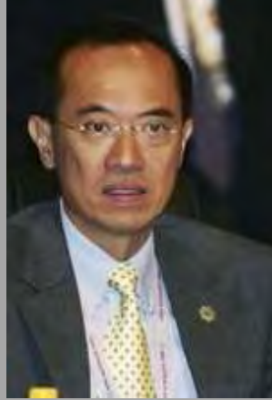
George Yeo (အာဆီယံဆိုင်ရာ စင်္ကာပူနိုင်ငံခြားရေးဝန်ကြီး)

“မြန်မာပြည်ကငြိမ်းချမ်းစွာဆန္ဒဖော်ထုတ်လို့ အဖမ်းခံရသူတွေအတွက် အထူးစိုးရိမ်နေပါတယ်။ သူတို့ကိုရော အခြားနိုင်ငံရေးအကျဉ်းသားတွေကိုပါ ပြန်လွှတ်ပေးပြီး အခြေခံလူ့အခွင့်အရေးတွေကို သေသေချာချာလေးစားဖို့ အာဏာပိုင်တွေကိုတောင်းဆိုပါတယ်” (သူမ၏သက်တမ်းအတွင်း မြန်မာပြည်၏လူ့အခွင့်အရေးအခြေအနေ အပေါ် ထုတ်ဖော်ပြောလေ့မရှိသဖြင့် အဝေဖန်ခံနေရသူတစ်ဦးဖြစ်သည်။)