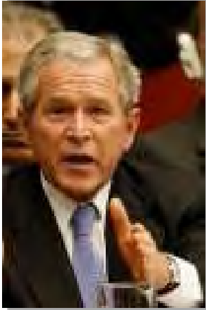
အမေရိကန်သမ္မတ အိမ်ဖြူတော်

ယနေ့ မြန်မာပြည်တွင်းတွင် ပြည်သူလူထုလက်တွေ့တွေ့ကြုံခံစားနေရသည့် လူမှုရေး၊ ကျန်းမာရေး၊ ပညာရေး နှင့် အထွေထွေကုန်ဈေးနှုန်းကြီးမြင့်ခဲ့ခြင်းများ စသည့် လူမှုဒုက္ခအကြပ်အတည်းများကြောင့် ဖြစ်ပေါ်လာသည့် ဆန္ဒပြလှုပ်ရှားမှုများအား နအဖစစ်အစိုးရမှ လူမဆန်စွာ အကြမ်းဖက် နှိပ်နှင်းခဲ့သည့် အပေါ် နိုင်ငံတကာခေါင်းဆောင်များတစ်ချို့၏ ပြောကြားချက်များကို ထုတ်နှုတ်တင်ပြလိုက်ခြင်းဖြစ်သည်။