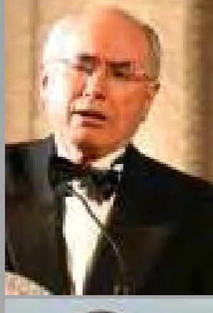
John Howard (ဩစတြေးလျား နိုင်ငံခြားရေးဝန်ကြီး)

“ဩဂုတ် (၁၉) ရက်နေ့က စတင်ခဲ့တဲ့ ဆန္ဒပြပွဲများအတွင်း လူတရားကျော်ကို ရက်ရက်စက်စက်ရိုက်နှက်ဖမ်းဆီးခြင်းဟာ နိုင်ငံတကာရဲ့ လူ့အခွင့်အရေးစံနှုန်းတွေကို ချိုးဖောက်တာဖြစ်တဲ့အတွက် နိုင်ငံတကာအသိုင်းအဝိုင်းတခုလုံးကို စော်ကားလိုက်ခြင်းဖြစ်တယ်”