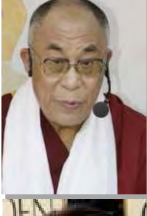
ဘုန်းတော်ကြီး ဒလိုင်းလားမား

“ထိတ်လန့်စရာကောင်းတဲ့ အကြမ်းဖက်မှုတွေကို ရက်ရက်ရောရောကျူးလွန်ရတဲ့ လုံးဝဥသို့ ရှံရှာစက်ဆုပ်ဖွယ်ကောင်းတဲ့ စစ်အုပ်စုဖြစ်တယ်”